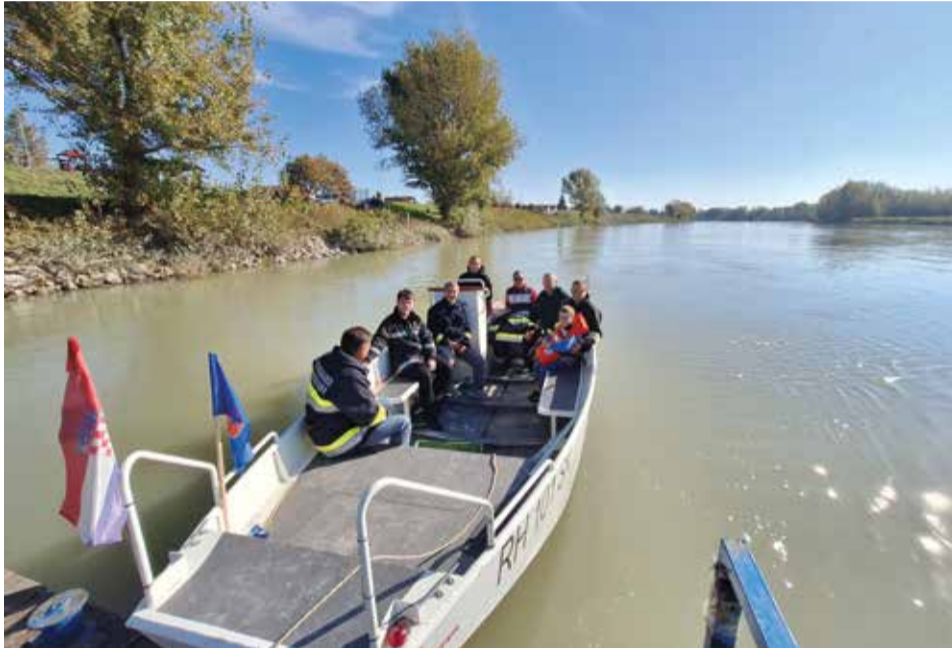
Ekipe budućih „skipera“ spremna za isplavljanje na dodatnu obuku

Ono na što nitko ne može utjecati su vremenske nepogode. Tako je naš kraj početkom mjeseca kolovoza u nekoliko navrata bio izložen olujnom nevremenu. Drugog dana kolovoza snažan je vjetar srušio dva stabla u okolici Donje Dubrave: jedno na cesti prema Kotoribi, a drugo u pravcu Koprivnice, iza mosta preko rijeke Drave. Naše su ekipe odmah izašle na teren i oba srušena stabla su uklonjena u samo nekoliko sati te je tako omogućen nesmetan promet na obje ceste. I za kraj, tijekom