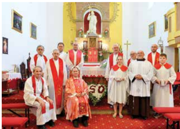
Svećenici i ministranti na proštenju