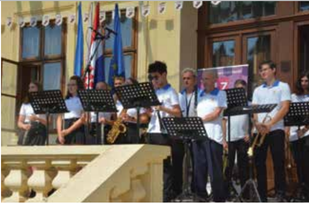
17. Dani ljuka i ekološke proizvodnje