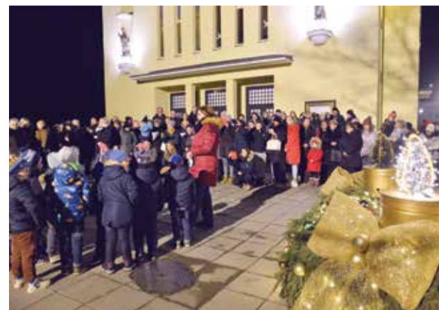
Paljenje prve adventske svijeće