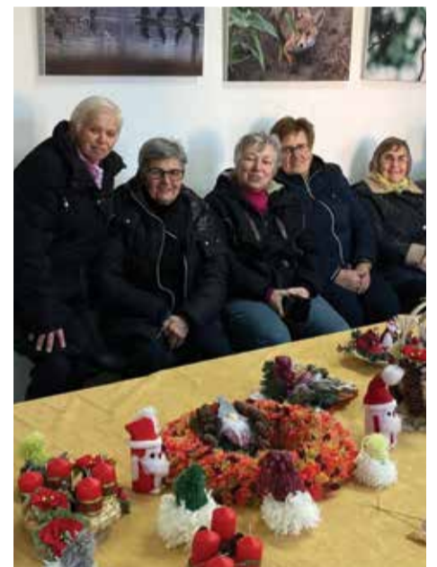
Adventske radosti v Dobravi