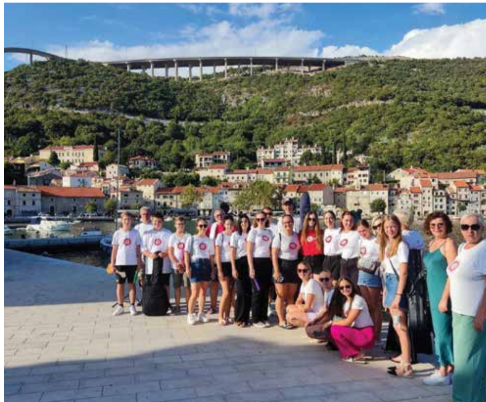
Nastup u Bakru

čovječanstva kao tradicionalni oblik pjevanja sjeverozapadne Hrvatske.