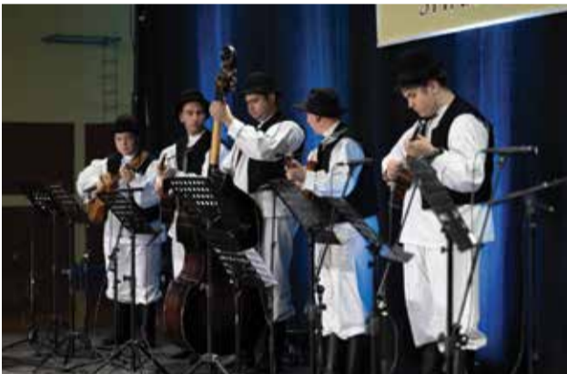
Tamburaši na Smotri dječjeg folklor