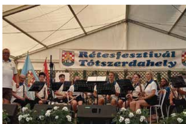
Nastup na Danima gibanice u Mađarskoj