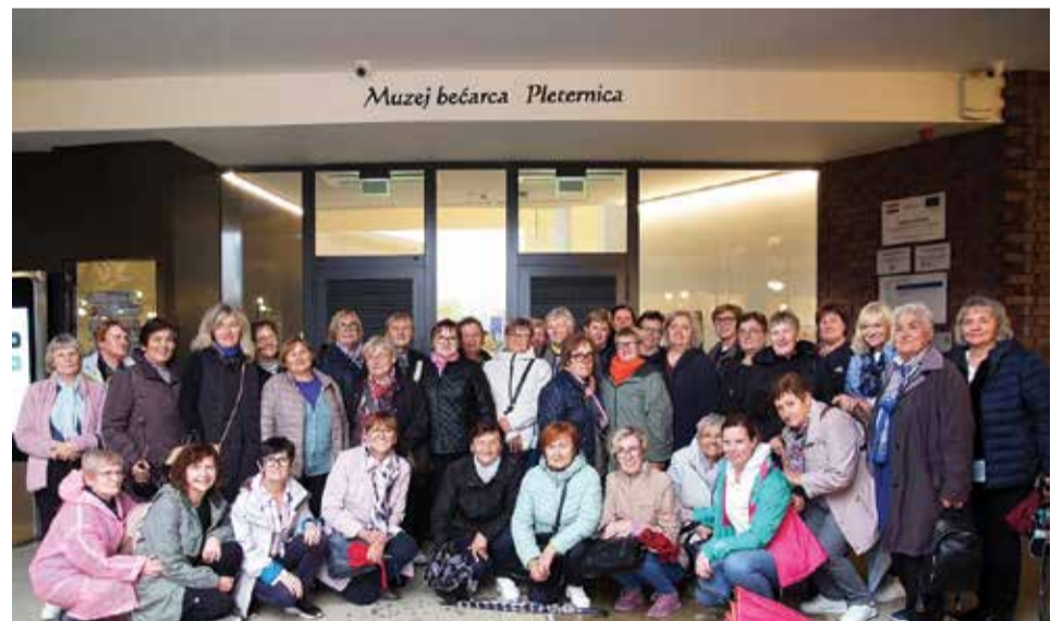
Ispred Muzeja bečarca