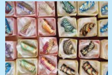
Naši šareni sapuni

neposrednim sudjelovanjem u izradi proizvoda, potvrđuju svoje mogućnosti i doživljavaju priznanje i zadovoljstvo svojim postignutim rezultatima.