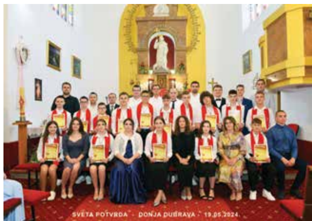
Firmanici i kumovi