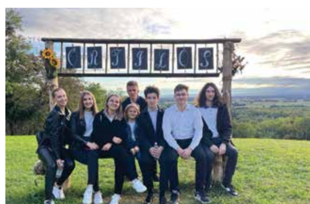
Kulturološki susreti Zrinski u Mađarskoj