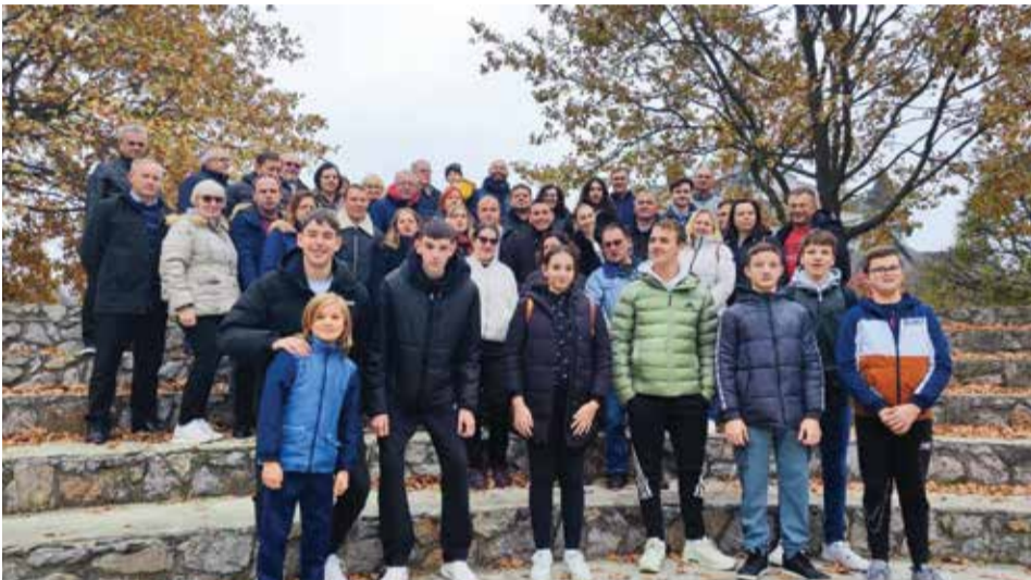
Puhači na dvodnevnom izletu

Puhački orkestar Općine Donja Dubrava tijekom 2024. godine odradio je ukupno 15 nastupa, dok će zadnji ovogodišnji odraditi dana 26.12.2024. godine i to 13., već tradicionalni, božićni koncert.