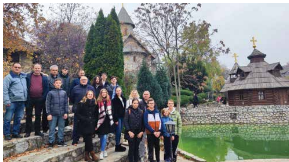
Puhači na dvodnevnom izletu - Etno selo Stanišići

25.8.2024. – 17. Dani ljuka i ekološke proizvodnje u Donjoj Dubravi