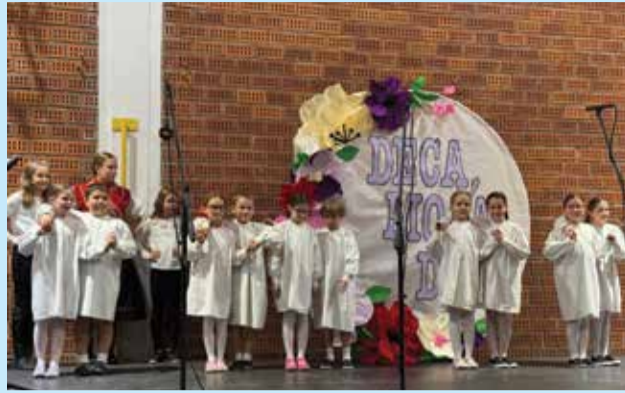
Folkloriši 2.a razreda

Gosti ovogodišnjeg susreta koji su nam se na pozornici pridružili u vrijeme prebrojavanja glasova publike, bili su članovi Hrvatskog pjevačkog društva „Zelina“ iz Svetog Ivana Zeline koje