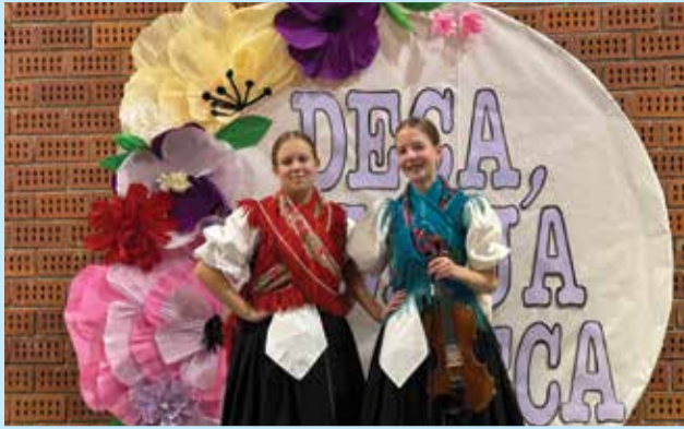
Dina i Bruna - glavne promotorice školskog projekta

U petak, 15. studenoga 2024. godine, u našoj je školskoj sportskoj dvorani održan 7. po redu „Susret malih čuvara međimurske popevke dobravske Tete Lize – Deca, moja deca“ kojeg već tradicionalno organiziramo u znak sjećanja na čuvaricu međimurske popevke Elizabetu Toplek, nadaleko poznatu kao Tetu Lizu.