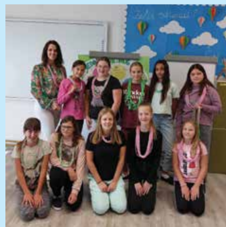
Radionice recikliranja mode