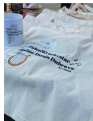
Platnene vrećice dobravskih puhača