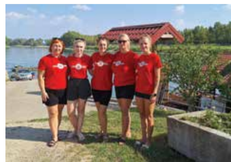
Ženska ekipa KUD-a na Dravskoj regati