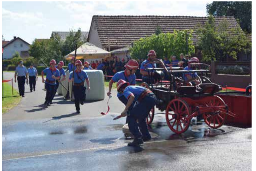
Ekipe DVD Donja Dubrava u Svetoj Mariji