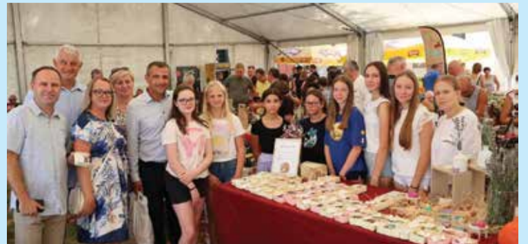
Na Danima ljuka i ekološke proizvodnje

Učenička zadruga „Pupoljak“ dugi je niz godina bila poznata po čuvanju tradicije pletenja proizvoda od komušine. Od prošle školske godine proširili smo svoj asortiman i osim rada na komušini, okrenuli se izradi prirodnih kozmetičkih, higijenskih i uporabnih proizvoda od ljekovitog bilja.