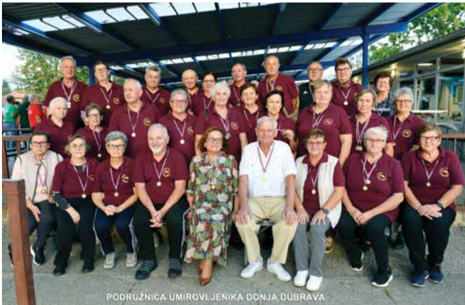
PODRUŽNICA UMIROVLJENIKA DONJA DUBRAVA

Bliži nam se kraj ove kalendarske godine u kojoj smo uspješno realizirali sve svoje planirane aktivnosti.