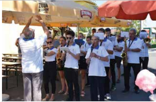
27. „Međunarodno natjecanje sa zaprežnim špricama“