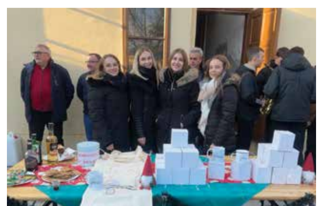
3. adventske radosti v Dobravi