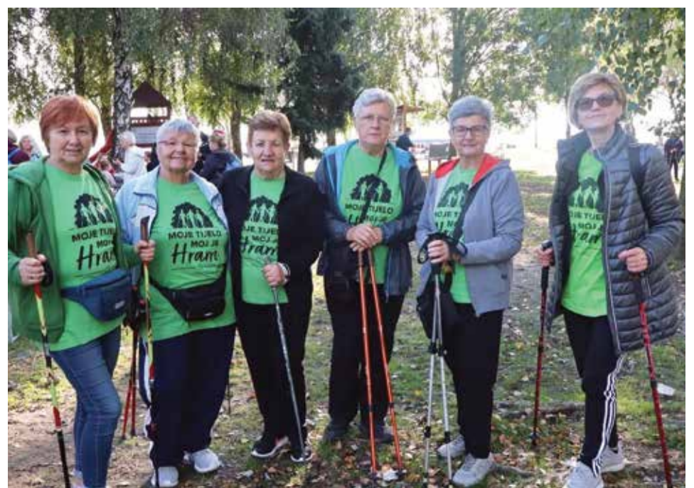
Osmi Festival nordijskog hodanja i pješčenja na Marini Prelog