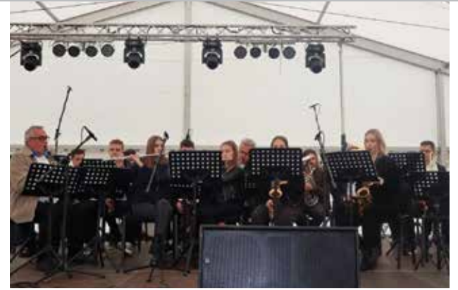
Dani Općine Kotoriba