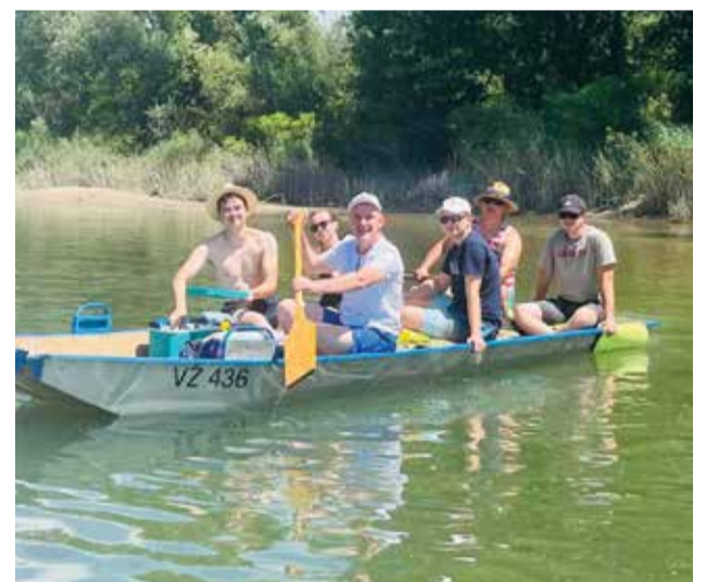
Puhači na raftingu