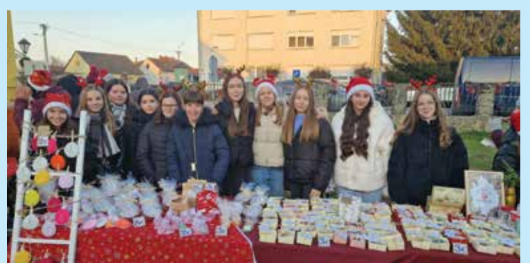
3. Adventske radosti v Dobravi

ulja od bilja s naših gredica. Uskoro nam stiže i destilator koji će nam upravo to i omogućiti pa će se brojni opojni mirisi naći u još puno raznih proizvoda koje ćemo pokušati izraditi. Zimski period iskoristit ćemo za istraživanje još neisprobanih tehnika izrade sapuna kako bismo naš asortiman osvežili novim proizvodima, a nestrpljivo iščekujemo proljeće kad će opet živnuti prostor ispred škole pun mirisnog bilja i podariti nam neke nove mirise koji će se širiti našom školom. Hvala svima vama koji kupnjom naših proizvoda podržavate rad naše zadruge.