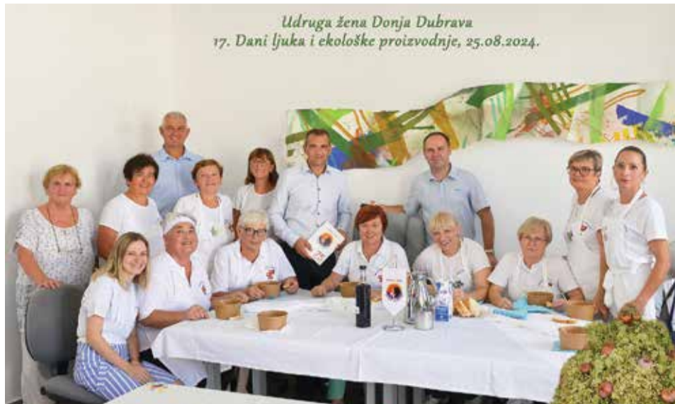
Na Danima ljuka i ekološke proizvodnje uz župana

Prva aktivnost Udruge nakon ljetnog odmora bili su 17. dani ljuka i ekološke proizvodnje. Uz izložbu fotografija Katarine Frančić, koja nas je podsjetila na svih 16 godina održavanja ove manifestacije, prostor je uljepšala i instalacija Kristine Pongrac inspirirana rijekom Dravom. Brojni posjetitelji uživali su u finim kolačima i langošima koji su neizostavni dio našeg doprinosa ovom događanju.