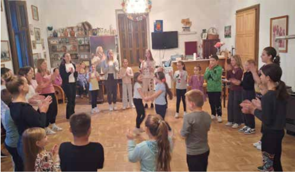
Ogledni sat za najmlađe