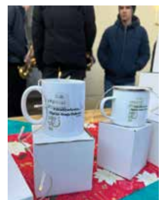
Šalice i lončiči dobravskih puhača

Nadalje, u Kotoribi smo 15.9.2024. godine održali kratki koncert povodom obilježavanja Dana Općine Kotoriba, a 28.9.2024. godine nastupili smo u mjestu Őrtilos povodom obilježavanja Kulturoloških susreta Zrinski.