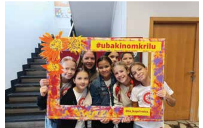
U bakinom krilu