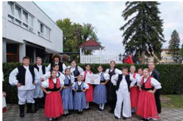
U bakinom krilu