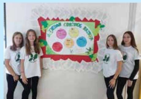
Tjedan održivog razvoja