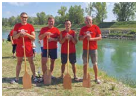
Muška ekipa KUD-a na Dravskoj regati

Elizabeta Toplek, poznatija kao Teta Liza, najpoznatija je čuvarica međimurske popevke. Rođena 16. studenoga 1924. godine u Donjoj Dubravi, ove godine bi proslavila 100. rođendan. Desetljećima je svojim vokalnim sposobnostima promovirala izvornu međimursku pjesmu kroz tisuće nastupa. Dobitnica je brojnih nagrada, među kojima su dva Porina, a iza sebe je ostavila brojne biografske zapise i priče. Teta Liza popularizirala je međimursku popevku na nacionalnoj razini, a zahvaljujući njoj i brojnim nositeljima međimurske narodne baštine, međimurska popevka uvrštena je na UNESCO-ovu reprezentativnu listu nematerijalnih kulturnih dobara