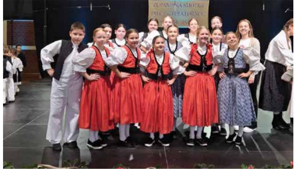
Smotra dječjeg folklor

Iz izvješća selektora: Vidi se da su to djeca iz mjesta gdje svojevremeno djelovala legendarna Elizabeta Toplek popularna teta Liza. Djece su svojom izvedbom pokazala kao se čuva dignitet i visoki kriterij u izvođenju međimurskog folklor koji je promovirala teta Liza. U svim segmentima izvrsno. Pjevaju zvonko i točno. Ujednačeni u koraku i pokretu te se organizirano kreću po prostoru scene. Frizure zategnute, baš kako treba i suknje odnosno pregače poravnate. Samo tako nastaviti.