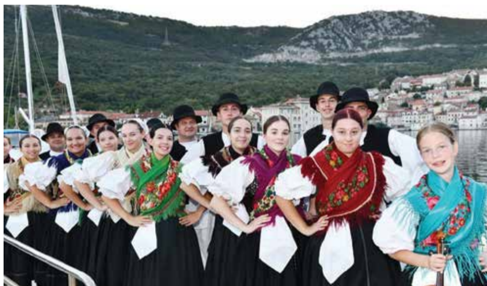
Nastup u Bakru

mlađi članovi – dječja sekcija KUD-a. Ovim putem želimo zahvaliti svim Dobravčanima i Dobravčicama te tvrtkama koji nesebično podupiru rad Sloge i njihovih članova. Također, zahvaljujemo i Općini Donja Dubrava koja razumije potrebe kulturno umjetničkih društava te ih u skladu s njihovim radim i financira. Financijsku ruku pomoći uvijek nam pruža i Međimurska županija kao i Ministarstvo medija i kulture Republike Hrvatske.