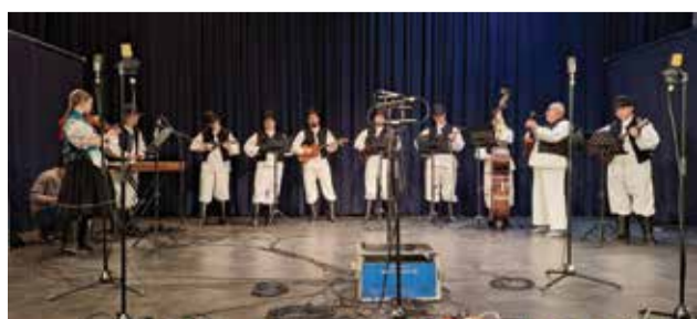
Glazbeni dio materijala snimili su tamburaši