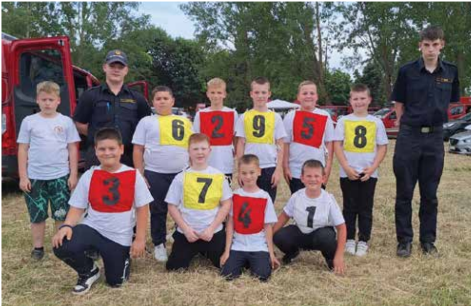
Naši najmlađi natjecatelji...

I vatrogasna natjecanja su svojevrsan oblik uvježbavanja naših članova za stvarne intervencije. Naravno, u natjecanja su uključeni i naši najmlađi članovi koji su se 30. svibnja u Turčišću natjecali na županijskom natjecanju djece i mladeži. Sudjelovali smo s dvije ekipe: jednom ženskom i jednom muškom, a ova potonja je ostvarila odličan rezultat osvajanjem 8. mjesta između više od četrdeset ekipa iz cijelog Međimurja.