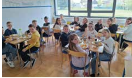
Na „gablecu“ u učiteljskom kabinetu