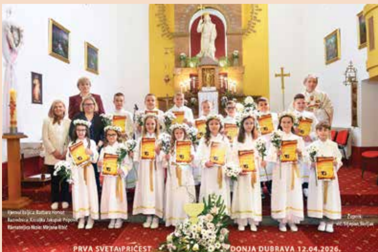
PRVA SVETA PRIČEST DONJA DUBRAVA 12.04.2026.