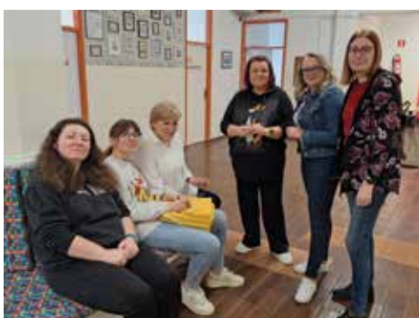
Učitelji i ravnateljica u časkanju na hodnicima