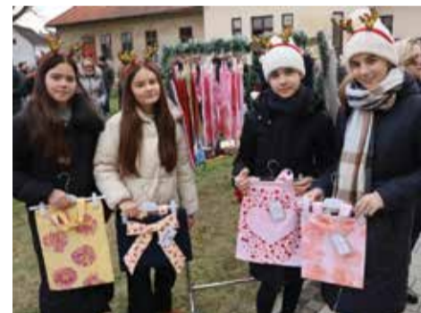
Učenice predstavljaju proizvode koje su same izradile