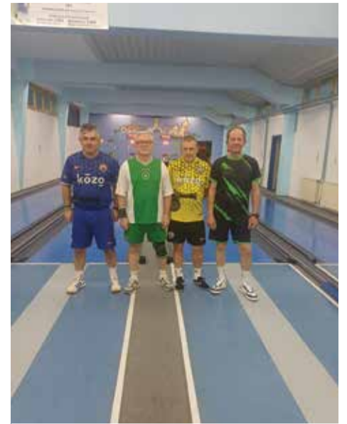
Pojedinačno prvenstvo županije

Kuglači Dubravčana su završili još jednu ligašku sezonu na začelju tablice. Upisali su dvije pobjede, osvojili 4 boda koja nisu bila dovoljna za plasman među četiri prvoplasirane ekipe. Prva pobjeda je bila najveće iznenađenje jer je ostvarena u gostima protiv tada vodeće ekipe Ceste. Ona je uz povoljan raspored završnice prvenstva davala nadu za plasman u doigravanje. Međutim kiks je bilo već slijedeće kolo protiv Obrtnika. Tri cifre ispod 500 su bile previše makar i protivnik nije odigrao ništa, osim jedne vrhunske cifre blizu ženskog rekorda koprivničke kuglane. Do zadnjeg kola su slijedile solidne utakmice sa ekipnim ciframa oko 3200 srušena čunja ali bez bodova. Zadnja dva su osvojena protiv Elektro iz Križevca ali nedovoljna za pomak na tablici.