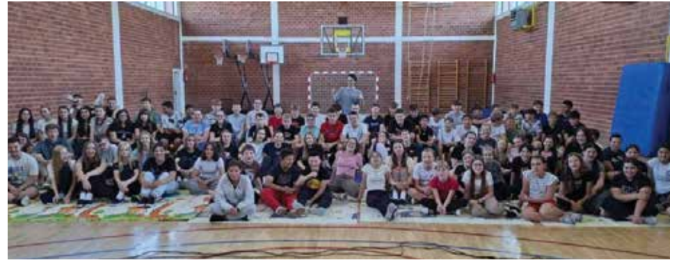
Sudjelovanje u projektu Ruksak pun kulture

I ove je godine naša škola bila uključena u projekt Ruksak (pun) kulture, nacionalni program Ministarstva kulture i medija te Ministarstva znanosti i obrazovanja koji dovodi vrhunske umjetnike i kulturne sadržaje izravno u vrtiće i škole. U utorak, 26. svibnja 2026. godine u našoj je školi gostovalo kazalište „Smješko“ iz Zagreba s predstavom „Zbroji se“. Predstava je namijenjena učenicima od 5. do 8. razreda, a učenici su iz predstave saznali da čovjek današnjice tjedno za mobitelom provede jedan cijeli dan i koliko je matematika zapravo važna u svim sferama života. Nakon predstave učenici su sudjelovali i na edukativnoj radionici i pub kvizu u kojem su imali priliku pokazati svoje matematičko znanje te su oduševili gostujuće glumce i postigli do sada najbolji uspjeh na razini Hrvatske.