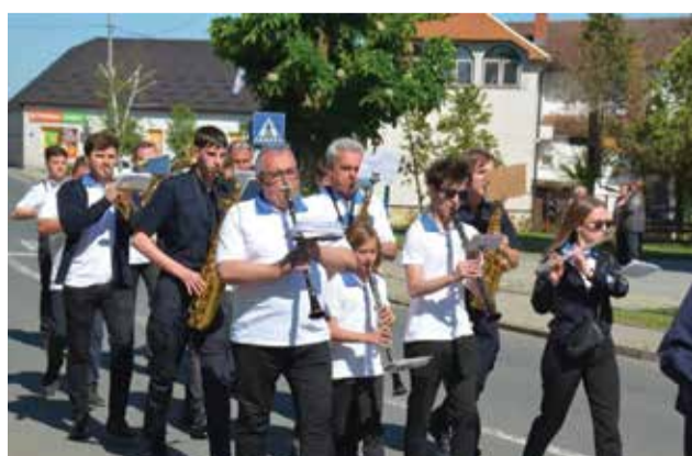
Dan sv. Florijana