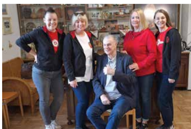
Članice KUD-a također su ugrabile svoj trenutak za fotografiranje