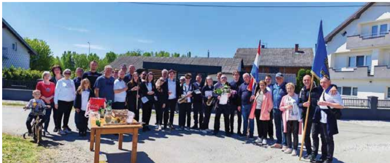
Prvomajska budnica - Prekop United