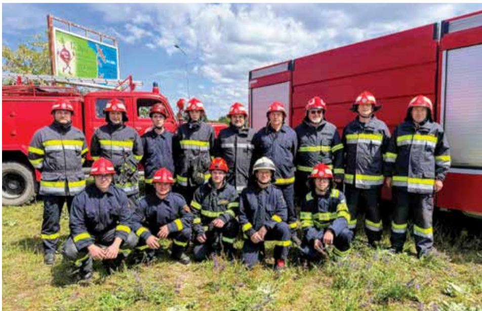
Vježba „Drava 2026“ je gotova. Posprema!

Iako jedno bez drugog ne ide, teoretska obuka je jedno, a praksa nešto sasvim drugo. Zato smo 17. svibnja za naše članove održali vježbu „Drava 2026.“ na kojoj smo nove članove upoznali s našom vatrogasnom opremom i podučili ih pravilnom rukovanju s njom te pravilima ponašanja na vatrogasnoj intervenciji. Ujedno je starijim i iskusnijim članovima to bio dobar podsjetnik na neke stvari koje se, što je sasvim razumljivo, s vremenom zaborave.