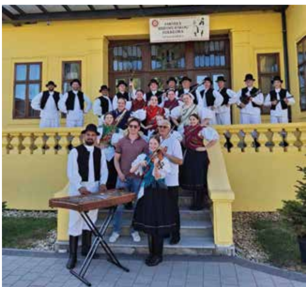
Snimanje s Vidom Bagurom

Početkom svibnja članovi društva ugostili su istaknutog hrvatskog koreografa Vidu Baguru te su sudjelovali u snimanju materijala za jubilarnu 60. Međunarodnu smotru folklor u Zagrebu. Slogaši su bili sudionici i prve međunarodne smotre, pa im je sudjelovanje na jubilarnom izdanju predstavljalo posebno priznanje.