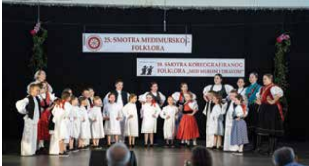
Nastup najmlađe dječje sekcije na Smotri uz podršku malo starijih kolega