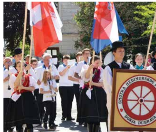
Na Smotri folklor