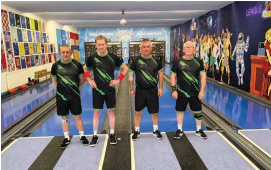
Turnir u Zaboku