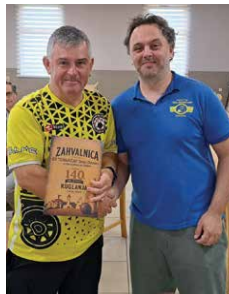
Proslava 140. godišnjice kuglanja u Čakovcu

Za službeni kraj sezone se još čeka redovni prijelazni rok. Plan je da se sa treninzima krene odmah na početku sedmog mjeseca. Nadamo se da će slijedeća biti puno uspješnija od prethodne.