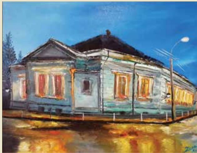
Galerija /// Horvat predstavljena je javnosti na Danima dobavrske baštine 31. siječnja 2026. godine

Pedesetak godina kasnije, 1927. godine, osnovana je „Dubravka“, dubravska najstarija kulturna udruga građana koju danas sljedi KUD Seljačka sloga Donja Dubrava i nogometno-prosvjetno društvo „Ujlaki Hirschler i sin“ koji danas nosi ime „Dubravčan“. Oba društva su aktivna i danas te će iduće godine slaviti okruglih sto godina.