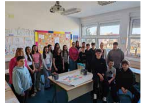
Učenici OŠ Donja Dubrava u posjetu vršnjacima iz Kotoribe