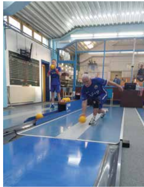
Igrek najbolji igrač Dubravčana