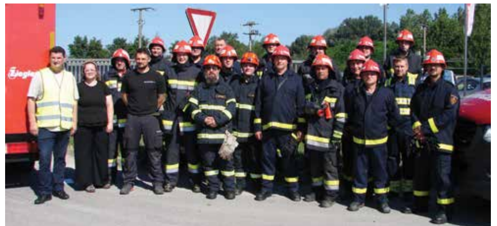
Sudionici vježbe s predstavnicima firme MODULAZ group