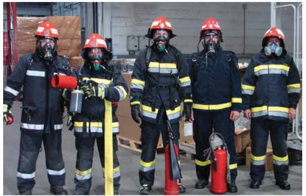
Ekipa opremljena aparatima za zaštitu dišnih putova prva je ušla na mjesto „požara“

No, najvažnija se vježba održala 19. lipnja u pogonima MODULAZ group / bivši „Alfa – car“. Pretpostavka javne pokazne vježbe bila je da je došlo do manjeg potresa pri čemu je jedan od djelatnika ozlijeđen. Izvršena je evakuacija zaposlenih, unesrećenom je pružena prva pomoć, no slijedilo i zapaljenje jednog stroja u proizvodnim halama. Pošto djelatnici nisu uspjeli sami ugasiti požar, obaviještena je Javna vatrogasna postrojba u Čakovcu koja je poziv prosljedila našem društvu. Dojava je zaprimljena u 9:00 sati, a na mjesto intervencije izašle su naše ekipe s tri vozila. Članovi prve ekipe su, opremljeni aparatima za zaštitu dišnih organa, ušli u hale noseći sa sobom priručne aparate za početno gašenje požara, a ostatak ekipe je pripremao vod za gašenje pjenom. Druga je ekipa s navalnim vozilom bila zadužena za hlađenje cisterne s propan/butan plinom jer je postojala opasnost da se vatra proširi, pa je cisterne trebalo preventivno zaštititi od pretjerane temperature. Treća je grupa bila zadužena za dostavu vode (dopunjavanje rezervoara cisterne i navalnog vozila) za slučaj da predviđena količina vode ne bude dovoljna za uspješno gašenje. Nakon vježbe, održan je sastanak na kojem su analizirani svi postupci i vatrogasaca i zaposlenika firme te donesene preporuke kako u stvarnom slučaju još efikasnije i brže djelovati.