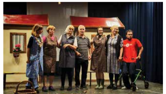
Copernice v Belici