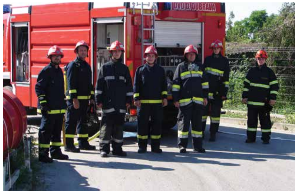
Ekipa za pripremu voda za gašenje pjenom, voda za hlađenje spremnika s plinom i voda za dopunjavanje cisterne vodom