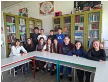
Uredništvo školskog lista