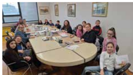
Zbornica je vrvjela mladim učiteljima