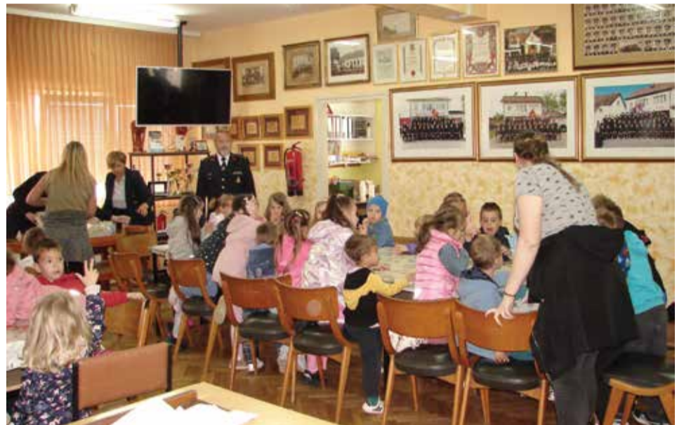
Druženje na kraju susreta

Proslave su ležerniji i zabavniji oblik našega posla, osobito tijekom svibnja. Tako u „Mjesecu zaštite od požara“ redovito organiziramo posjet polaznika dječjeg vrtića vatrogasnom domu.