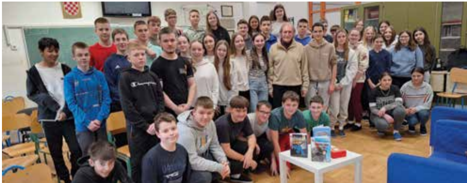
Učenici 7. i 8. razreda s književnikom Dubravkom Jelačićem Bužimskim

Susret je završio zajedničkim fotografiranjem te potpisivanjem knjiga koje će učenici sa zanimanjem čitati.