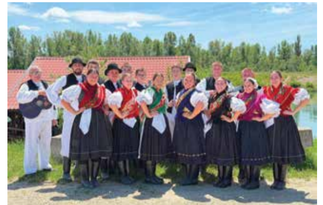
Razglednica s Drave

Lipanj je donio nove nastupe i promociju međimurske kulturne baštine. Dio dobavskog folklorog nasljeđa predstavljen je turistima koji su u Donju Dubravu stigli u sklopu međunarodnog projekta Mystical Danube. Već sljedećeg dana članovi društva ponovno su stali pred kamere, ovoga puta za potrebe Turističke zajednice Međimurske županije, nastavljajući promicati kulturne vrijednosti svoga kraja. Kako je kultura važna sastavnica turizma, članovi KUD-a su sredinom lipnja nastupili na početnoj konferenciji projekta „Two Rivers One Goal“ koji se provodi u okviru Programa Interreg Mađarska – Hrvatska 2021. – 2027.