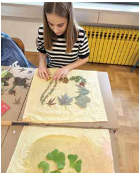
Radionica otiskivanja bilja na tekstil

Ove školske godine projekt Sto života jedne biljke prijavljen je Ministarstvu obrazovanja za financiranje aktivnosti s učenicima u kojima će upoznati život jedne biljke od sadnje do njezine upotrebe u različitim spektrima našeg života, a kojeg Ministarstvo obrazovanja sufinancira u iznosu od 2,9 tisuće eura. Naglasak projekta je na uzgoju ljekovitog i začinskog bilja. Učenici su se kroz predavanja i radionice u