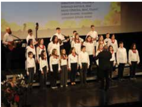
Veliki zbor naše škole nastupio je na Smotri pjevačkih zborova