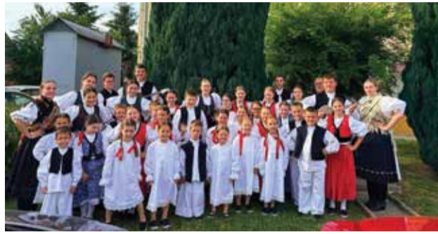
Dječja folklorna skupina na nastupu u Donjem Vidovcu

Dječja folklorna sekcija nastavila je s nastupima tijekom svibnja. Najmlađi članovi sudjelovali su na manifestaciji „Majci na dar“ u Donjem Vidovcu, dok je sredinom mjeseca društvo ugostilo poznatog novinara i televizijsku legendu Gorana Milića. Tijekom snimanja dokumentarnog filma predstavljeni su međimurska narodna nošnja, plesovi, popevka te život u Donjoj Dubravi i Međimurju.