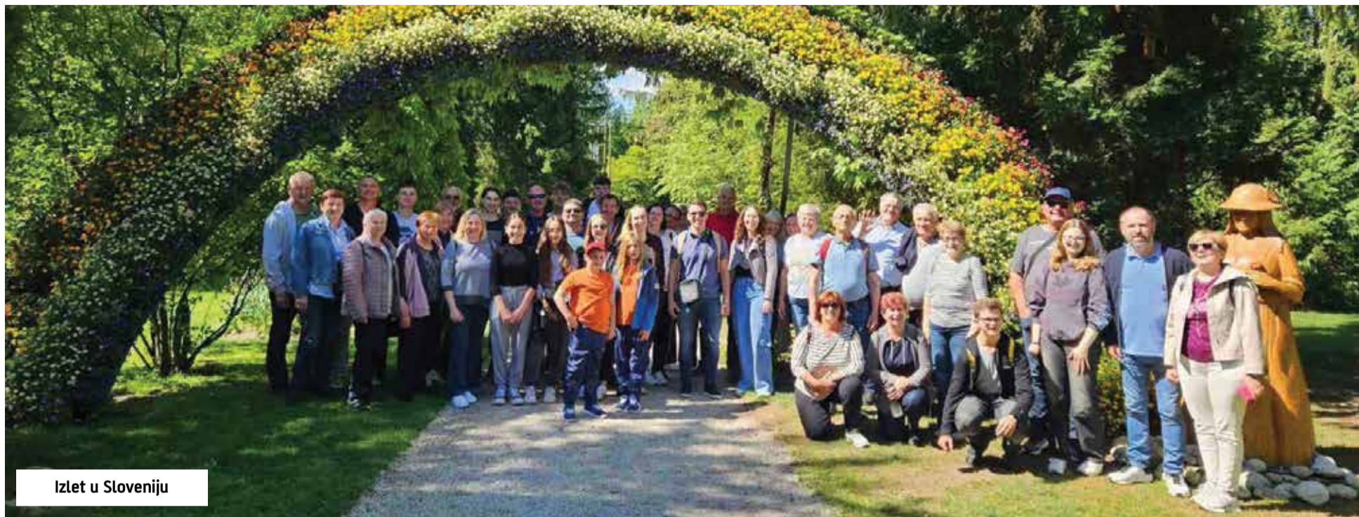
Izlet u Sloveniju

Puhački orkestar Općine Donja Dubrava tijekom prve polovice 2026. godine sudjelovao je u nizu događanja i aktivnosti koje su obilježile kulturni i društveni život naše općine. Godina je započela nastupom na tradicionalnom Dobravskom fašenjku 15. veljače, gdje je orkestar glazbenom pratnjom sudjelovao u povorci kroz mjesto te dao svoj doprinos ovom omiljenom događaju koji svake godine okuplja velik broj mještana i posjetitelja.