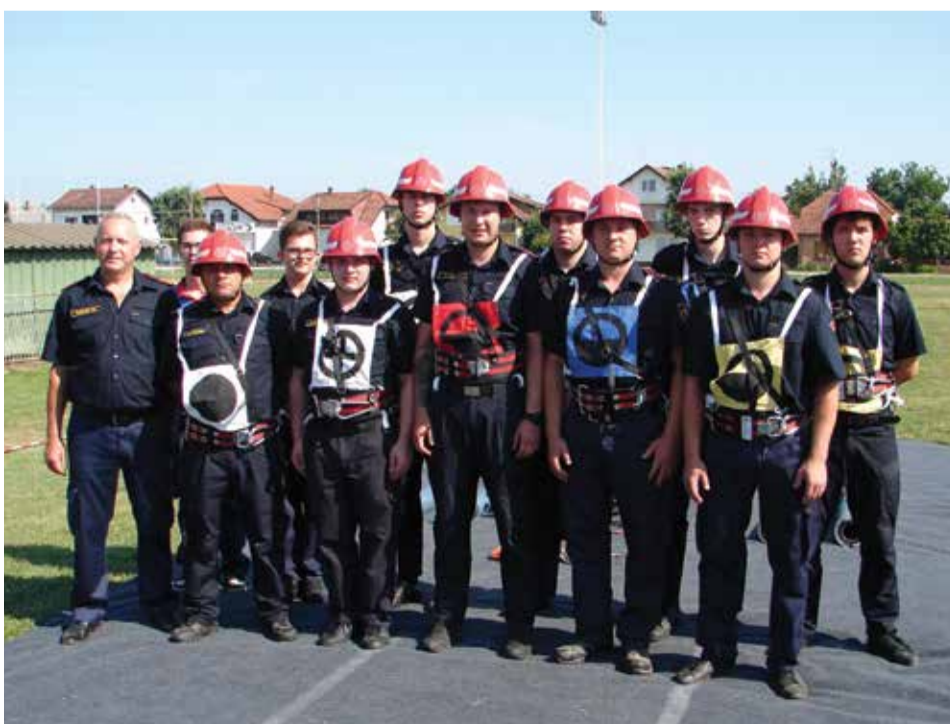
Seniorska ekipa DVD Donja Dubrava

Naši vatrogasci – seniori imali su 22. lipnja u Donjoj Dubravi natjecanje s VMŠ. Osim domaćina iz Donje Dubrave nastupile su ekipe (njih ukupno devet) iz Kotoribe, Svete Marije, Donjeg Vidovca i Donjeg Mihaljevca. Naša muška ekipa osvojila je solidno 3. mjesto.