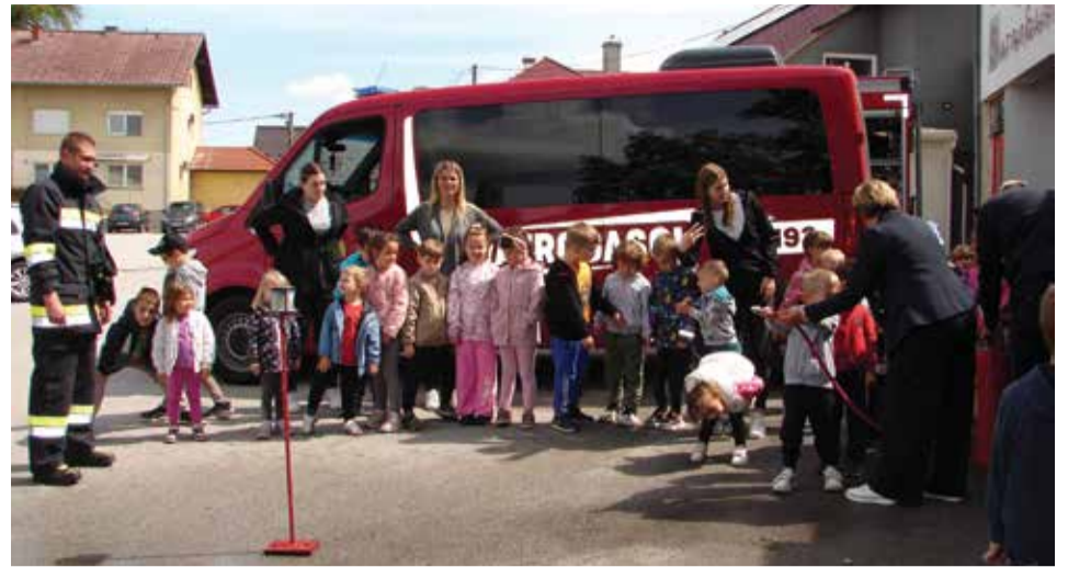
Najzanimljiviji dio posjeta: gađanje mete brentačom

Proslave su ležerniji i zabavniji oblik našega posla, osobito tijekom svibnja. Tako u „Mjesecu zaštite od požara“ redovito organiziramo posjet polaznika dječjeg vrtića vatrogasnom domu.