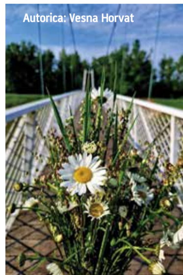
Autorica: Vesna Horvat

Sva autorska prava na poslane fotografije ostaju u vlasništvu autora, te se organizator natječaja obvezuje potpisivati fotografije