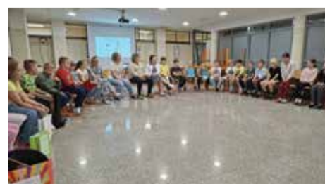
Sa završnog susreta u Dornavi