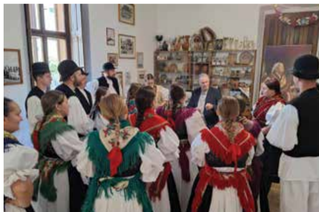
Razgovor o životu u Dobravi s Goranom Milićem

Svibanj je obilježilo i jedno posebno snimanje, u goste je članovima KUD-a stigla snimateljska ekipa na čelu s legendarnim novinarom Goranom Milićem. Snimljeni su brojni kadrovi koji prikazuju našu tradiciju, a članovi su s užitkom razgovarali s Goranom Milićem o folkloru, običajima, tradiciji, načinu života u Dobravi. Nakon snimanja, svi su bili oduševljeni jednostavošću gospodina Milića, a i snimanje za dokumentarni film s ovakvom ekipom prošlo je brzinom munje.