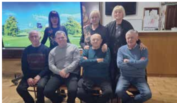
Glumačka ekipa predvođena legendarnim Markom Karlocijem

Tik nakon ove manifestacije, Slogaši su zasukali rukave te organizirali Dobravski fašenjki.