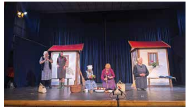
Dramska sekcija na sceni Festivala kazališnih amatera Međimurja