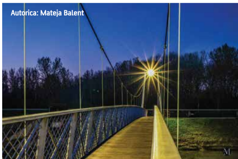
Autorica: Mateja Balent

Slanjem prijave na natječaj smatramo da dajete privolu i da ste suglasni s obradom osobnih podataka u svrhu provedbe fotografskog natječaja te da ste suglasni s objavljivanjem osobnih podataka (ime i prezime autora fotografije) na mrežnim stranicama Općine Donja Dubrava, društvenim mrežama, javnim medijima i raznim tiskanom izdanjima (brošure, letci i drugi promotivni materijali) u svrhu izvještavanja o realizaciji fotografskog natječaja i promocije Općine Donja Dubrava. Općina Donja Dubrava će s danim osobnim podacima postupati sukladno Zakonu o zaštiti osobnih podataka i Općom Uredbom (EU) 2016/679 o zaštiti osobnih podataka od neovlaštenog pristupa, zlouporabe, otkrivanja, gubitka ili uništenja.