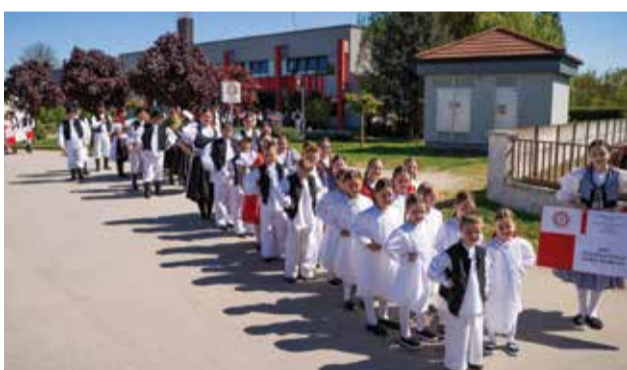
Mali folklorasi odradili su i svoj prvi veliki mimohod