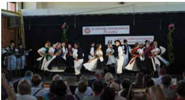
Nastup na Volodoreskim jesenima izborila je prva postava Sloge uz brojne pohvale