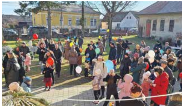
Više od šezdesetak mališana sa svojim je roditeljima dočekalo novu 2026. godinu točno u podne

Već 3. siječnja Slogaši su započeli s prvim probama nakon blagdana, a prvu probu je obilježilo sada već tradicionalno okupljanje članova svih generacija. Neki su od njih se prisjetili plesnih koraka nakon nekoliko godina odsustva, a tamburaši su pak prebirali po žicama kao da tambure u rukama imaju svaki dan.