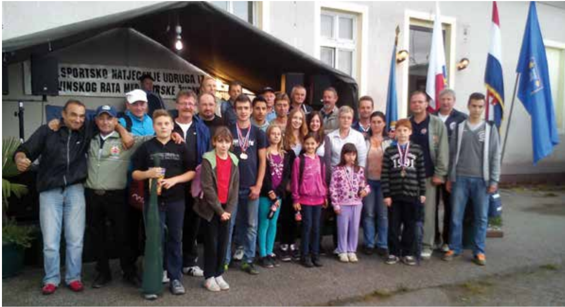
Na županijskom natjecanju u Mihovljanu

U ožujku 2014. održani su izvještajni sabor UDVDR-a ogranka D. Dubrava. Na njemu smo usvojili izvješće o radu te financijsko izvješće za 2013. godinu, kao i program rada te financijski plan za 2014. godinu.