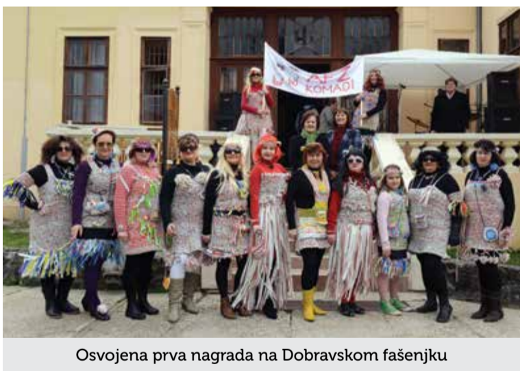
Osvojena prva nagrada na Dobravskom fašenjku

Dana 27. 4. slijedio je BI-MEP 2014. za koji smo opet organizirale dežurstva na punktu u dvorištu palače „Zalan“.