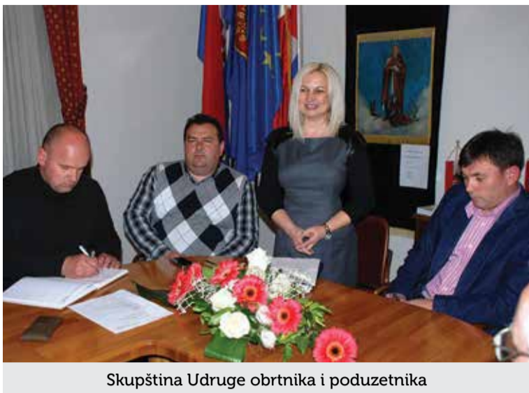
Skupština Udruge obrtnika i poduzetnika