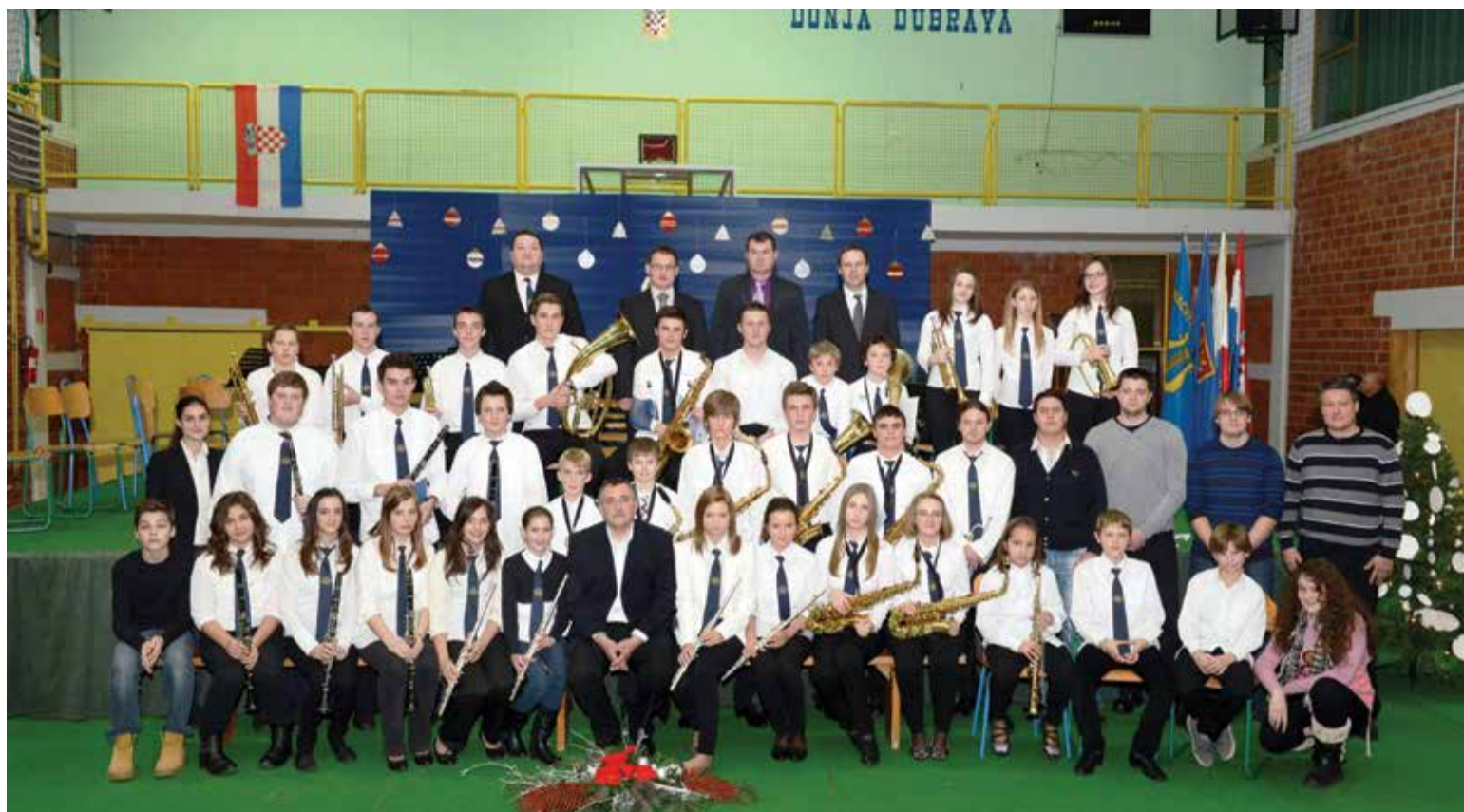
Peta godišnjica rada Puhačkog orkestra Općine Donja Dubrava

Od osnivanja Puhačkog orkestra Općine Donja Dubrava prošlo je gotovo šest godina. Tijekom tih šest godina uspjeli smo gotovo ni iz čega (osim sjećanja na nekadašnju Vatrogasnu limenu glazbu) stvoriti jednu respektabilnu i cijenjenu Udrugu, koja je izuzetno tražena, kako u Donjoj Dubravi tako i šire, da svojim nastupima uveličava raznovrsna događanja.