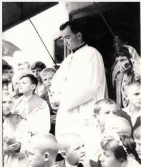
Pater dr. sc. Vladimir Horvat

tutu Družbe Isusove u Zagrebu. Za župnika je zaređen 1964., a mladu je misu služio iste godine u Donjoj Dubravi. Zbog nemogućnosti takva studija u Zagrebu, književnost studira od 1965. do 1970. na Filozofskom fakultetu u Beogradu (u to je doba bio kraće i kateheta u Sarajevu). Na sjemeništarskoj gimnaziji na Fratrovcu u Zagrebu počeo je predavati 1969., a od 1973. do 1975. prefekt je đaka u Dubrovačkom sjemeništu. Nakon što je magistrirao kod prof. Jure Kaštelana, povjerenom mu je vodstvo Hrvatske katoličke misije u Parizu. Tu pokreće katolički bilten „Naš glas“, a napisao je i znanstvenu knjigu o stradanju Alojzija Stepinca, koja je bila u svijetu prekretnica u reafirmaciji ovog blaženika. Prigodom posjete Hrvatske 1985. jugoslavenske su mu vlasti oduzele putovnicu, zbog čega se nije mogao vratiti u Pariz pa je bio poslan u isusovačku rezidenciju u Beograd. Tu se posvetio izučavanju prinosa znamenitog filologa Bartola Kašića te je otkrio Kašićev hrvatsko-talijanski rječnik iz 1599., što je bila prekretnica u izučavanju povijesti jezika. Kasnije je bio pročelnik