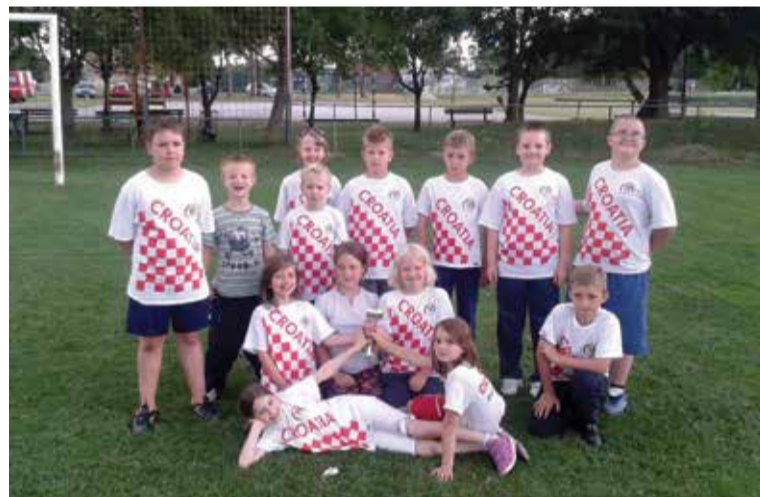
Natjecatelji u Donjem Mihaljevcu