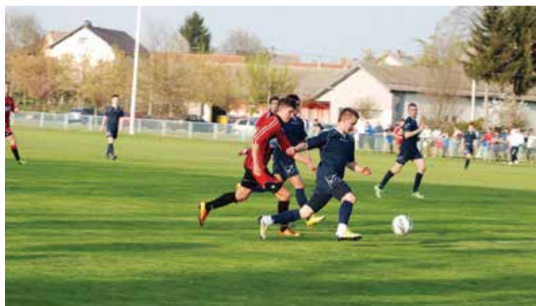
Detalj s juniorske utakmice

Poštovani čitatelji "Dobravskih novina"!