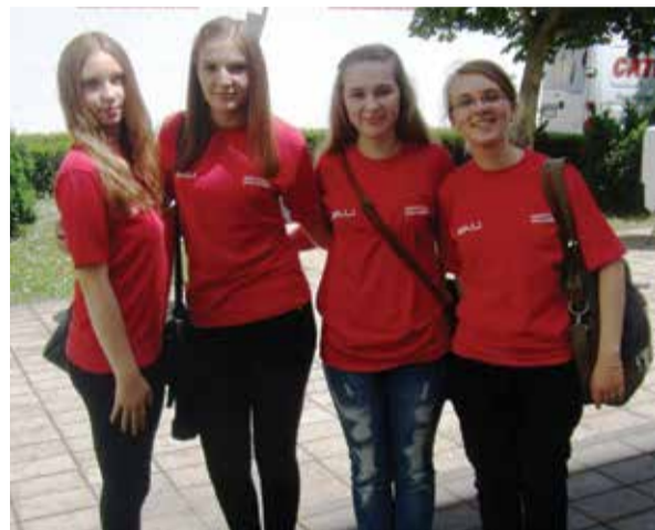
Učenicice na Državnoj smotri projekata iz područja Građanskog odgoja i obrazovanja

U nastavku pročitajte neka saznanja i zanimljivosti o dobnavskom ljuku do kojih su naše učenicice došle radeći na ovom projektu.