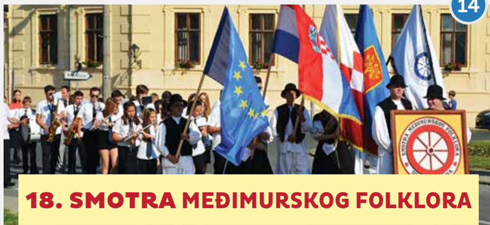
18. SMOTRA MEĐIMURSKOG FOLKLORA