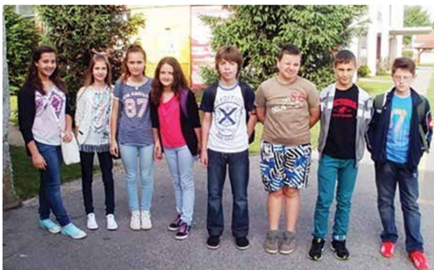
Sudionici Festivala matematike