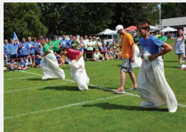
Skakanje u vreći