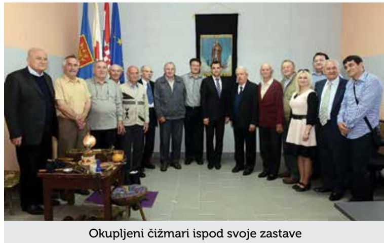
Okupljeni čizmari ispod svoje zastave