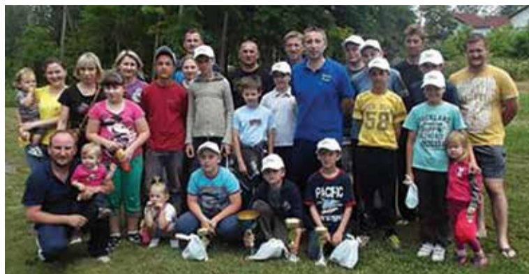
Nema straha za budućnost sportskog ribolova

Prvo natjecanje u drugom polugodištu bit će društveno seniorsko natjecanje. Bit će to prilika da naši mladi ribiči bodre u ulovu ribe svoje roditelje. Na kraju, svakako vas podsjećamo da ne zaboraviti da se 13. i 14. rujna na