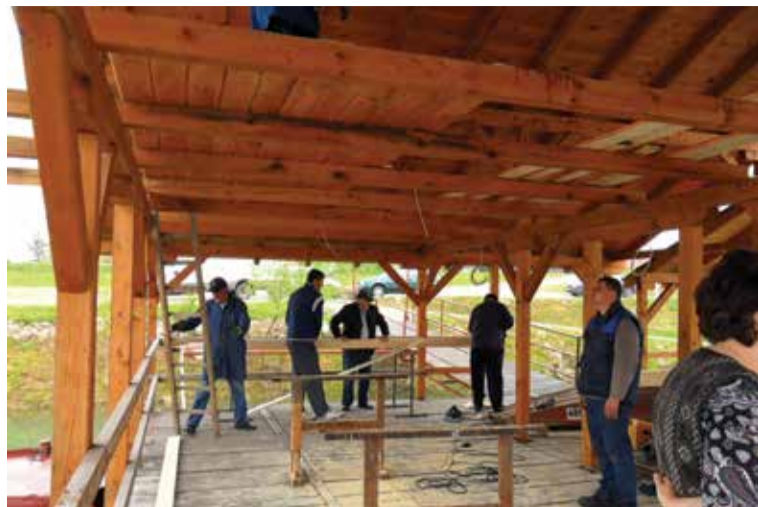
Radovi na uređenju skele

Na žalost većine naših članova kao i prošle godine, kada smo morali zbog vodostaja odustati od spusta do Vukovara, ove nas je godine u tome spriječila poplava u Slavoniji.