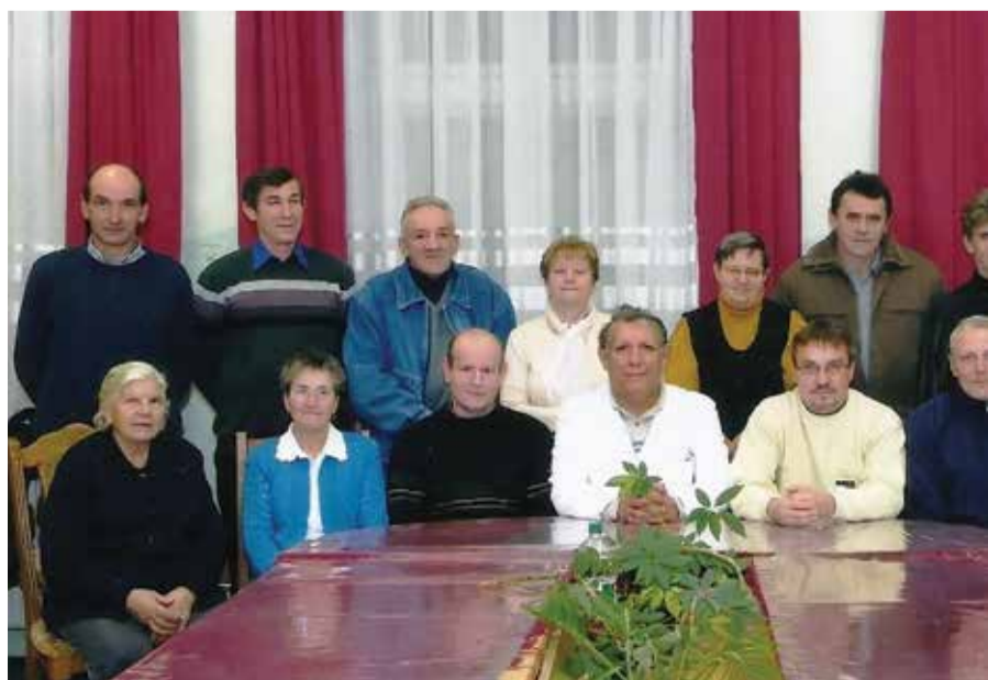
Članovi KLA „Osmijeh“