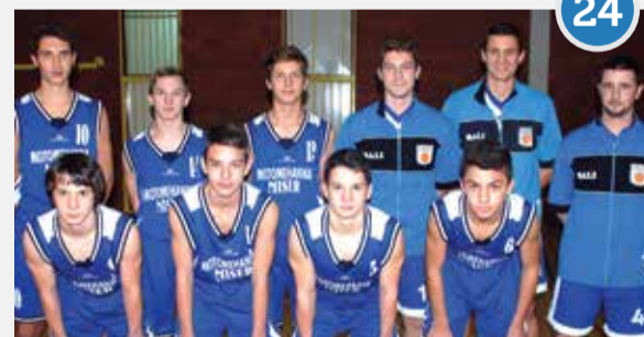
MLADE KOŠARKAŠKE NADE