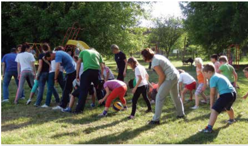
Zajednička igra i druženje roditelja i djece