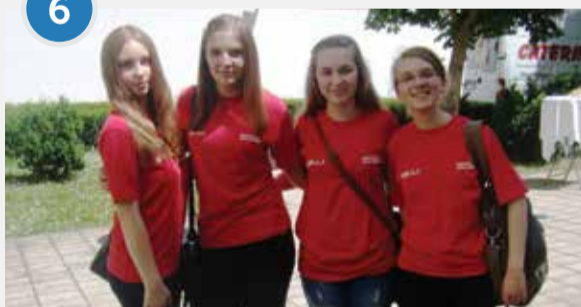
"DOBRAVSKI LJUK" U ZAGREBU