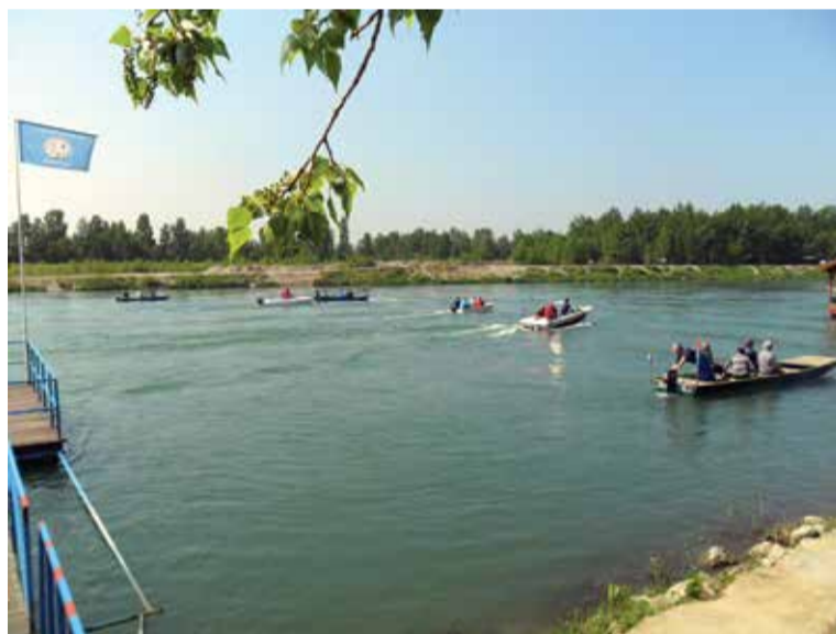
Smotra dravskih plovila za 1. svibnja