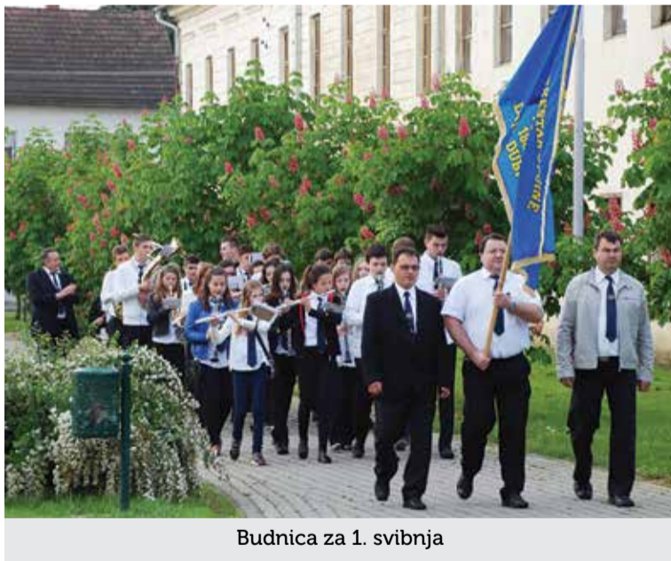
Budnica za 1. svibnja

pokazatelj je nezainteresiranosti za rješavanje problema kojih Orkestar ima, što je jako loše za daljnje funkcioniranje i opstojnost Puhačkoga orkestra u našem mjestu. Ne budemo li rješavali probleme, isti će nas pregaziti.