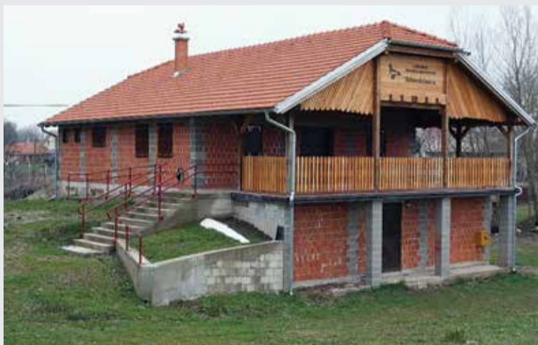
Dom Međimurske lastavice uskoro dobiva novo pročelje

Općinu (7,9 općinske, 6 km županijske, 5,5 državne), Općina će morati izdvojiti oko 240.000,00 kn u razdoblju od dvije godine. Otvoranjem bilo kakvog natječaja pokušat ćemo ovaj projekt kandidirati da se dio tih sredstava osigura putem sufinanciranja, a s Upravom hrvatskih cesta (koja ima ovo uvršteno u svoj Plan nabave) smo u pregovorima,