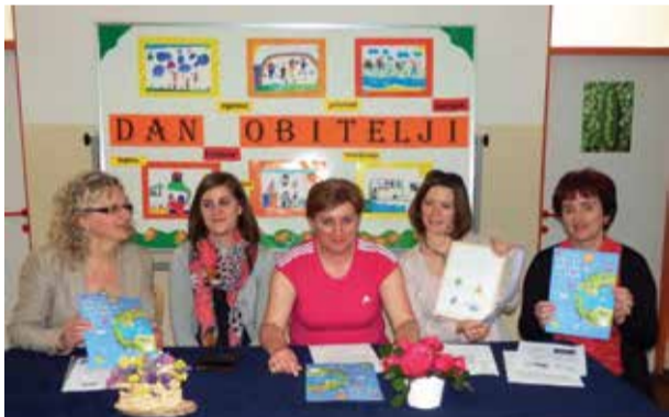
Predstavljanje brošure Zavoda za javno zdravstvo MŽ

Roditeljima je predstavljena brošura Zavoda za javno zdravstvo Međimurske županije -