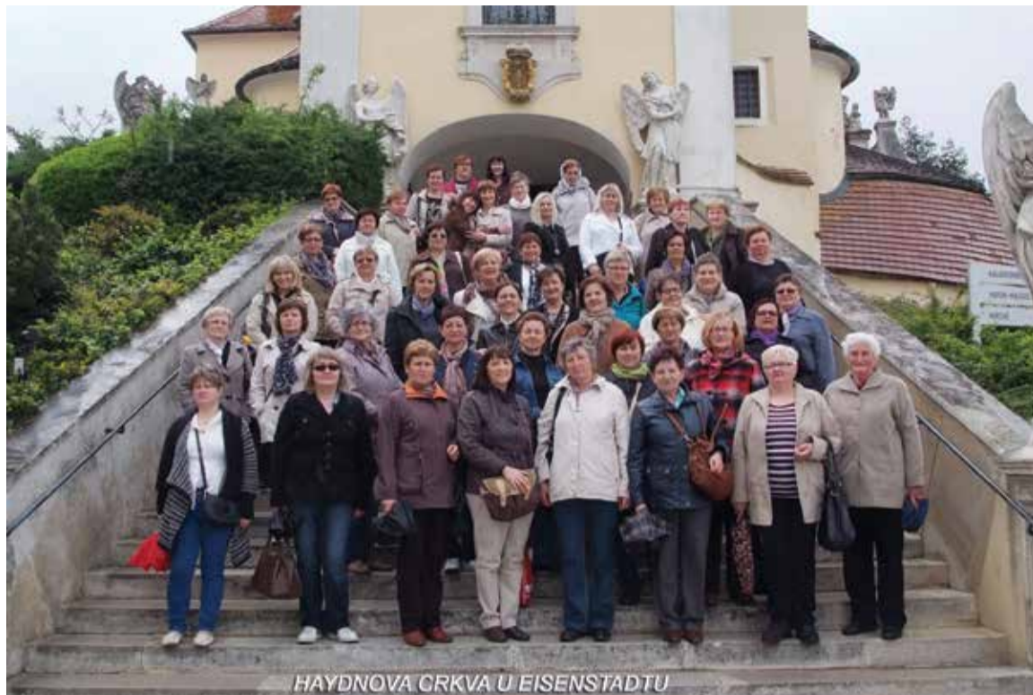
HAYDNOVA CRKVA U EISENSTADTU