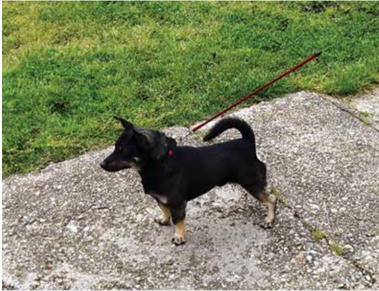
Campi – prvoupisani mužjak međija

Dugogodišnjim istraživanjem, proučavanjem i monitoringom izvornih pasmina malih životinja na području Međimurja, uočio sam malog međimurskog psa posebnog izgleda. Proučavajući kinološku literaturu, zaključio sam da nema