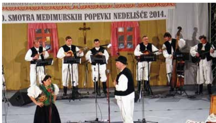
Nastup na 30. Međimurskoj popevki u Nedelišću