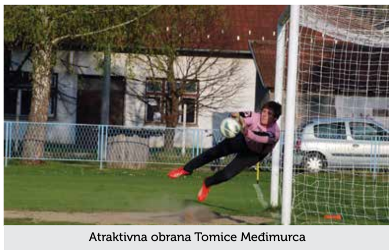
Atraktivna obrana Tomice Međimurca

Veliki su rezultat ove godine postigli juniori, pod vodstvom trenera Tihomira Vitkovića. Na kraju sezone zauzeli su prvo mjesto. U 14 odigranih utakmica osvojili