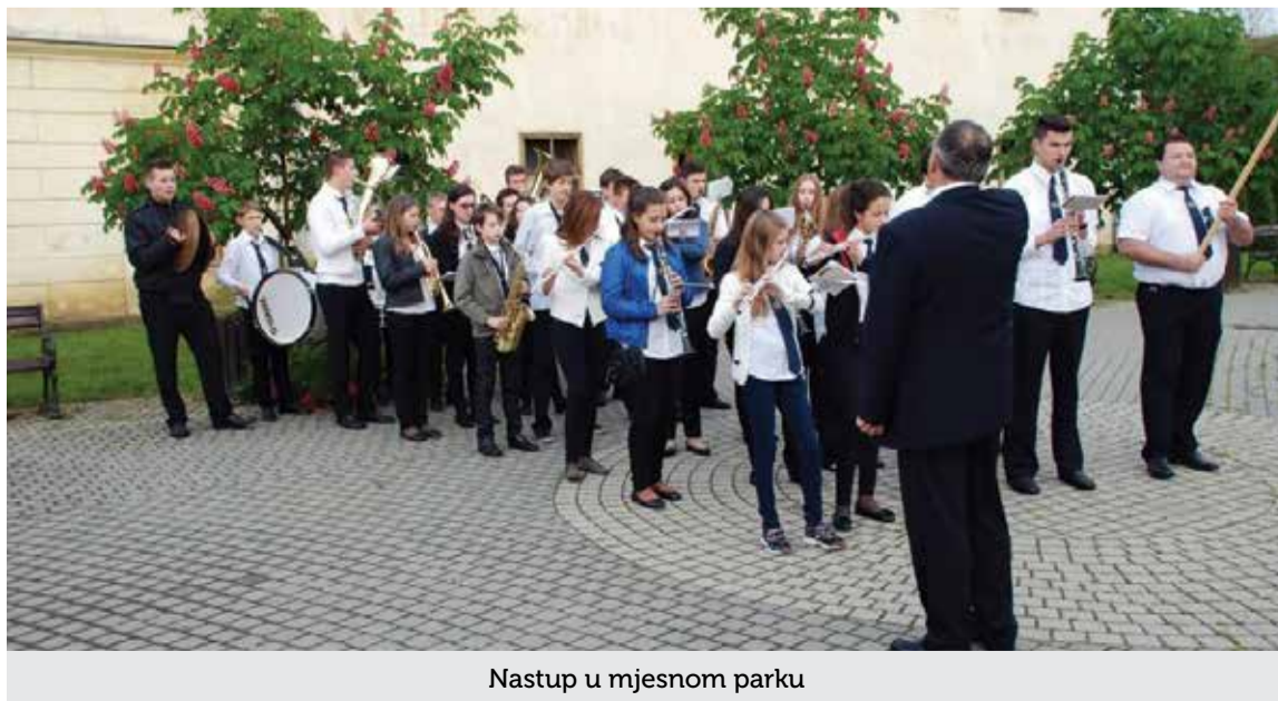
Nastup u mjesnom parku