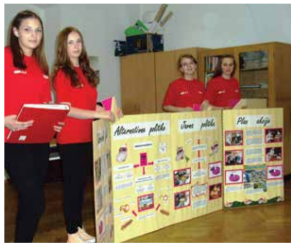
Predstavljanje projekta „Dobravski ljuk“