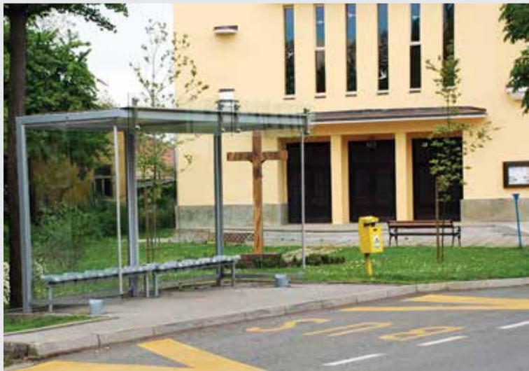
Autobusna postaja u novom ruhu

Zbog sve većeg broja vozila i potreba stanara po-