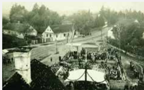
Svečanost posvećenja temelja (6.11.1938.)