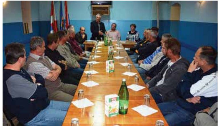
Podjela diploma o završenom informatičkom tečaju

Mihovljanu, natječući se u disciplinama kuglanju, boćanju, malom nogometu, streljaštvu, potezanju užeta, beli i pikadu. Djeca veterana natjecala su se u likovnoj radionici, modeliranju, pikadu i stolnom nogometu. Dražen Balog i Stefanija Golub u likovnoj radionici, Emil Kovač i Dominik Haramija u stolnom nogometu, Domagoj Haramija i Petar Jakupak u pikadu, plasirali su se na državno natjecanje djece dragovo-