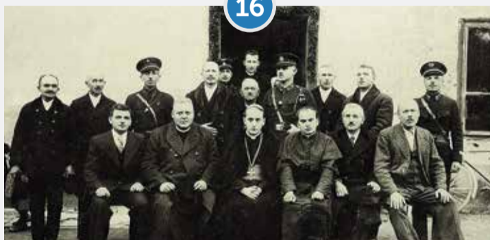
225. GODINA NAŠE ŽUPE