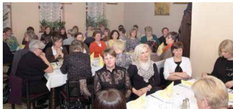
Izborna Skupština Udruge žena