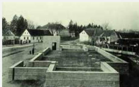
Betonski temelji za novu crkvu

Kada su 10. studenoga 1940. priređene velike svečanosti posvete crkve, vanjska fasada još nije bila ožbukana. Novine „Hrvatska straža“ pišu da je preuzvišeni gospodin nadbiskup Alojzije Stepinac došao u Donju Dubravu 9. studenoga 1940., a crkveni zbor pod ravnanjem kantora Ivana Horvata otpjevao mu je „Došli smo došli“ i „Vuprem joči“. Na večer su Dobravčani priredili veliku bakljadu u središtu mjesta. Obred posvete crkve trajao je 10. studenoga 1940. od 7 do 10:30 sati. Oko tri sata poslije podne prenijeta su u procesiji Sveta otajstva iz stare crkvene dvorane kraj školske zgrade u novosagrađenu crkvu. Svečanostima je bilo nazočno više od 4.000 ljudi. Među njima su bili i prečasni kanonik Mihovil Kanoti iz Varaždina, dr. Pernar, izasla-