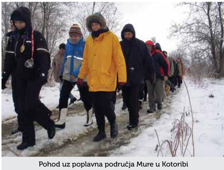
Pohod uz poplavna područja Mure u Kotoribi