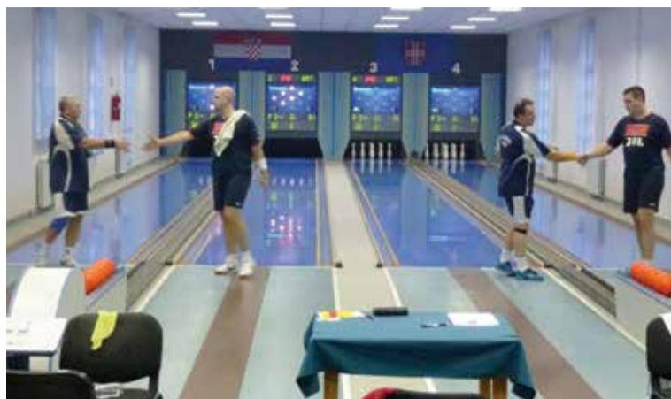
Utakmica „Zanatlija“ – „Dubravčan“

Par dana kasnije, na sastanku Izvršnog i Nadzor-