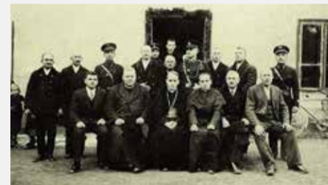
Crkveni odbor koji je vodio izgradnju crkve (10.11.1940.).