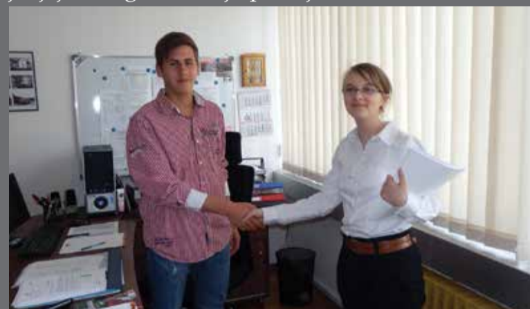
Zamjenski ravnatelj i zamjenska pedagoginja

bilo je vrlo živo! Osobito zanimljivo bilo je u razrednoj nastavi gdje su zamjenski učitelji zbog pomanjkanja visine koristili stolice kako bi mogli pisati po ploči. Toga dana svi su se odlično zabavili!