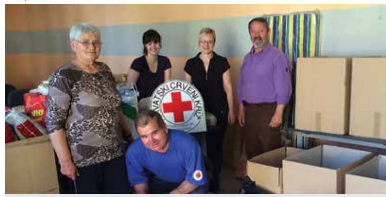
Prikupljanje pomoći za poplavljene