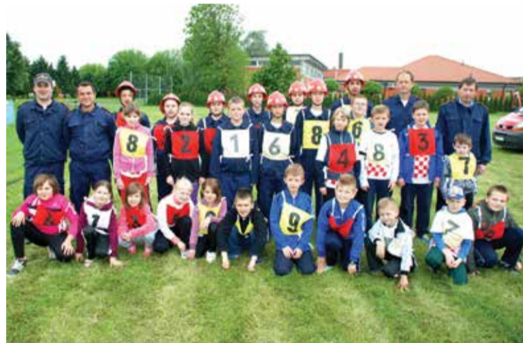
Ekipa DVD Donja Dubrava s mentorima na natjecanju VZP u Donjoj Dubravi

Stvorena je pretpostavka nailaska velikog vodenog vala koji je prijetio preljevanjem i probijanjem nasipa te su u pomoć pozvani pripadnici civilne zaštite i vatrogasci da povise postojeće nasipe, utvrde mjesta mogućeg proboja nasipa te