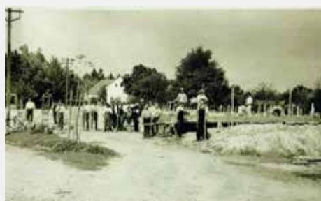
Betoniranje temelja (28.9.1938.)