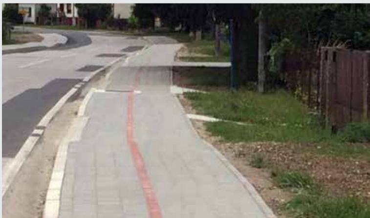
Pješačko-biciklistička staza u Podravskoj ulici

Zahvaljujući dobroj pripremi i postignutim dogovorima u jesenskom razdoblju 2013., početkom ove godine počela se rješavati sva potrebna dokumentacija za realizaciju dogovorenih projekata. Tako je s ravnateljicom Županijske uprave za ceste Međimurske županije - Ljerkom Cividini dogovoreno da se krene u projekt izgradnje pješačko-biciklističke staze lijevom i desnom stranom na dijelu županijske ceste LC 20039, ulica Podravska od benzinske postaje do izlaza na cestu uz odvodni kanal HE Dubrava, kao i u izgradnju pješačko-biciklističke staze na djelu županijske ceste LC 2041, ulice 3. travnja od raskršća sa Zagrebačkom pa desnom stranom do spoja na postojeću stazu na izlazu iz Donje Dubrave prema Kotoribi. Nogostupi su važni zbog sigurnosti prometa, a ponajviše pješaka i biciklista i stoga njihova izgradnja ne smije biti nimalo upitna. Ujedno molim sve vozače da svoja vozila ne parkiraju na nogostupima jer time ometaju prolaz pješaka i biciklista.