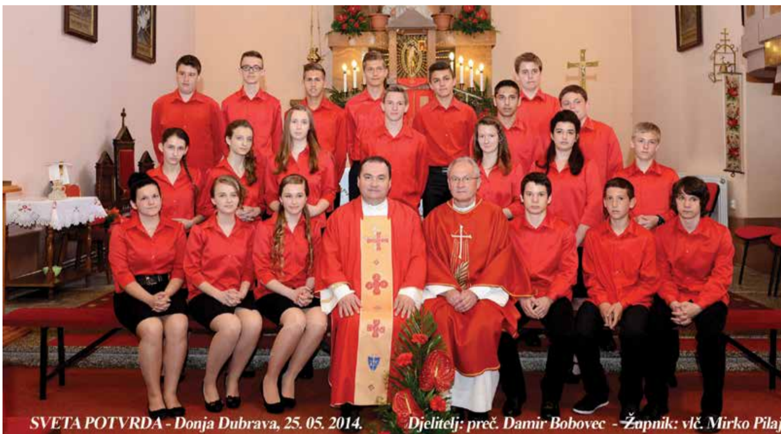
SVETA POTVRDA - Donja Dubrava, 25. 05. 2014.