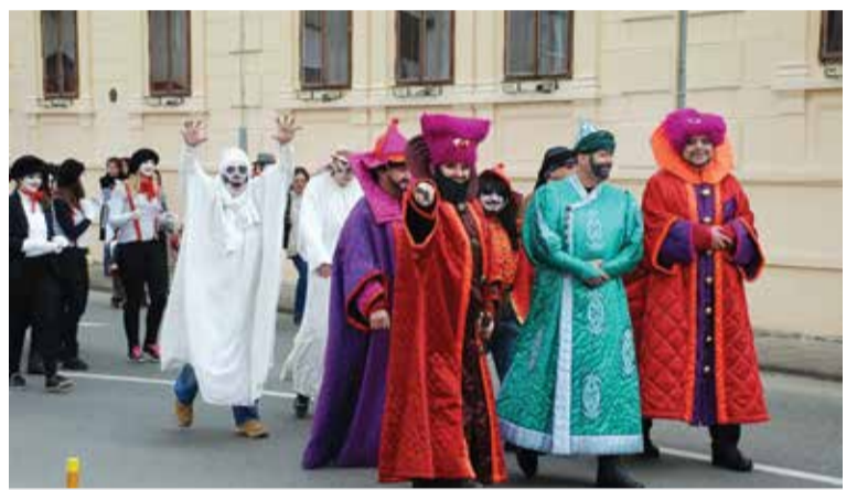
Dobravske duhove i Sulejman 22.

ljaca i veterana, koje će se krajem kolovoza održati u Savudriji u trajanju od 3 dana.