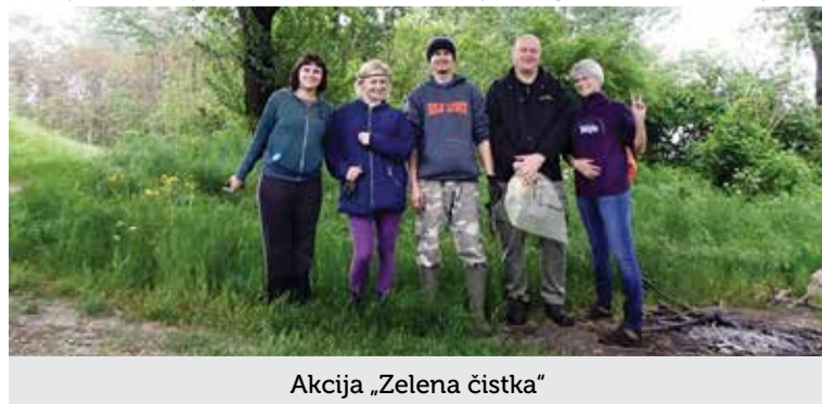
Akcija „Zelena čistka“

U subotu, 26. travnja udruga ZEUS je očistila dio između dubravskoga mosta i kafića „Poljdi“ koji nam svake godine za čišćenje dodjeljuje Općina. U sklopu akcije „Zelena čistka“ čistili smo i dionicu od dubravskoga mosta prema Otoku ljubavi. Vremenski uvjeti i raspoloživost članova omele je kakav veći pothvat koji kao udruga znamo organizirati povodom „Zelene čistke“ na području Dubrave ili Kotoribe. Za ovakve je akcije naša dugoročna nada da će, nakon duže prakse i proljetnoga općinskog čišćenja, i akcije „Zelene čis-