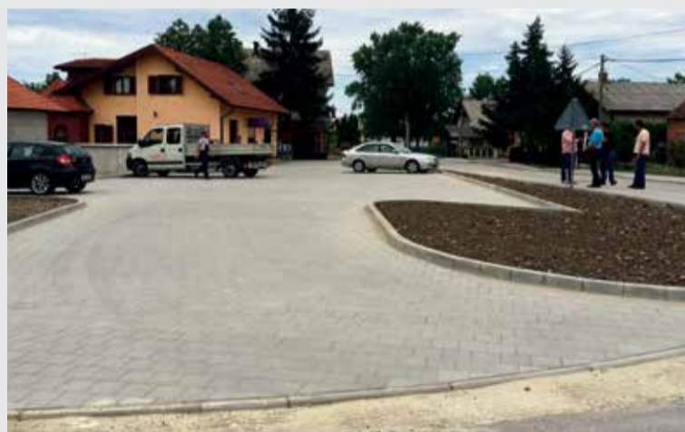
Parkiralište u Podravskoj ulici

je završiti hortikulturu), a ukupna vrijednost investicije iznosi 120.661,66 kuna. Osim Općine kao vlasnika parkirališta i ŽUC-a, u financiranju istoga sudjeluje i vlasnica obližnjeg ugostiteljskog objekta.