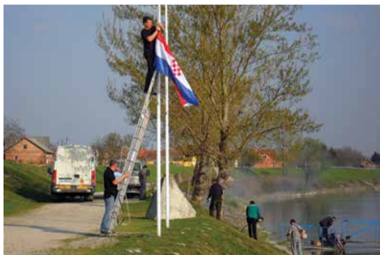
Radna akcija čišćenja obale