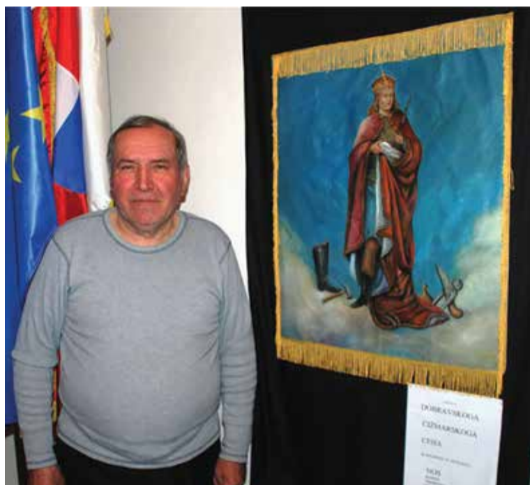
Zastava dobravskog čizmarskog ceha

„NA 35 STANOVNIKA JEDAN MAJSTOR ŠUSTER“, pisalo je u „Večernjem listu“ od 24. svibnja.