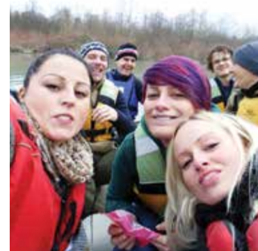
Siječnjaški zimski spust

Pazi se na (i)legalne radove na rijekama, na sve slučajeve devastacije ili pozitivne promjene, a provode se i opažanja promjena flore i faune. Cilj je da se na vrijeme „uhvate“ počeci i planovi radova te da se istraže i spriječe eventualne devastacije. U RH najgore i najčešće slučajeve devastacije provode upravo Hrvatske vode, a inspekcije su malobrojne pa WWF pridaje veliku važnost funkcioniranju ovoga projekta upravo u našoj zemlji.