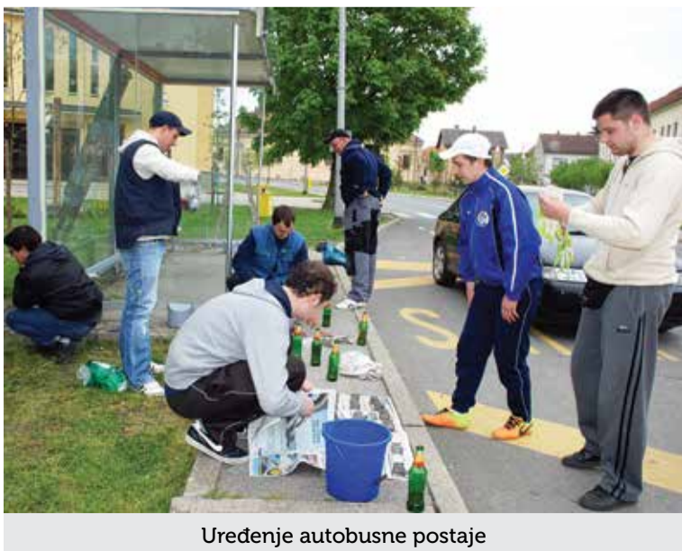
Uređenje autobusne postaje