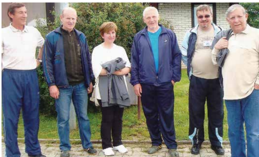
Jedan od naših susreta