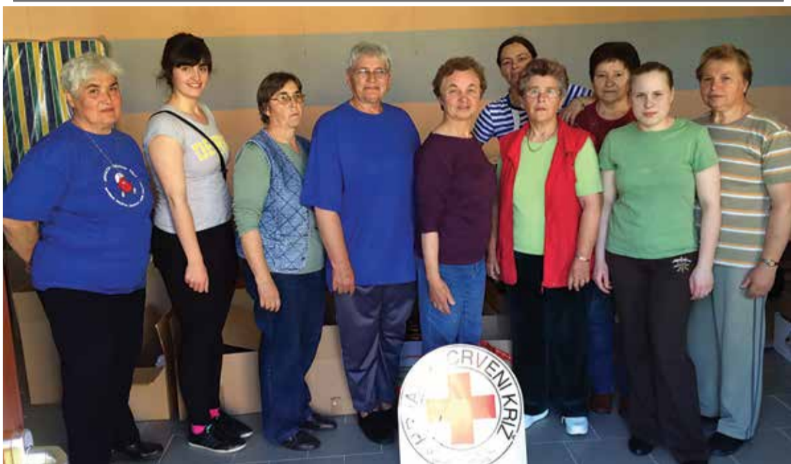
Članice Crvenog križa na okupu

Uloga je Crvenog križa pomaganje razvoja humanitarnih djelatnosti, koordinacija njihovim operacijama pomoći žrtvama prirodnih katastrofa (potresi, poplave, požari...).