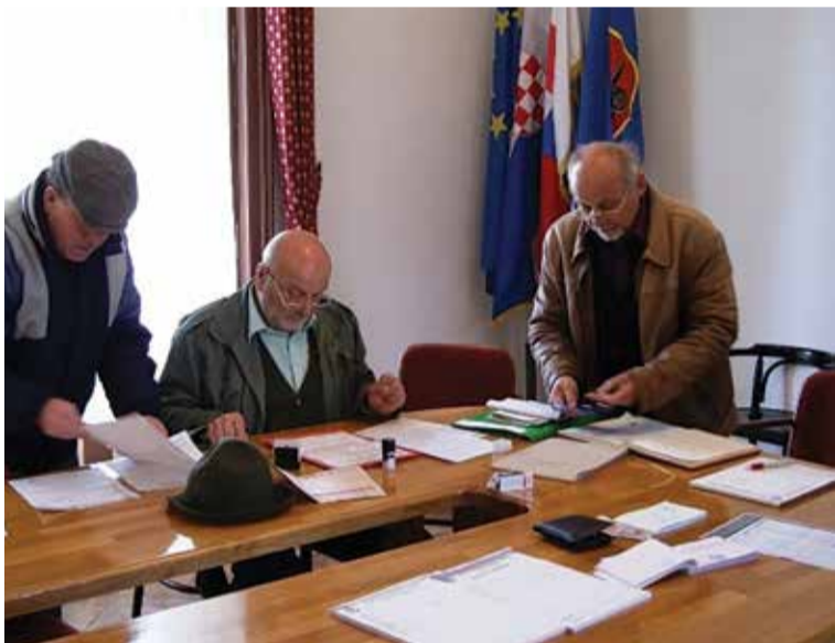
Povjerenstvo za ocjenjivanje na uzgojnom pregledu