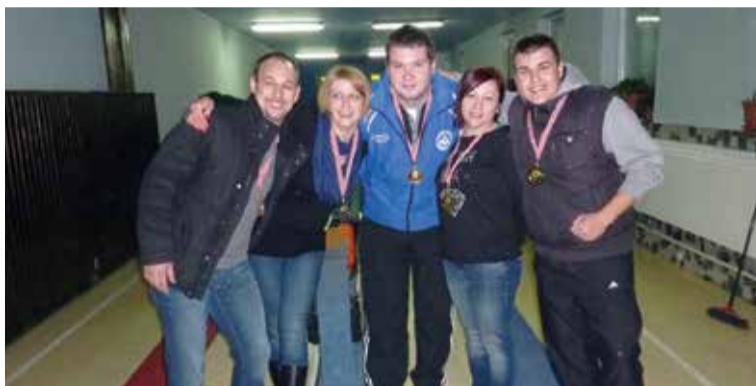
Božićni turnir – članovi s medaljama