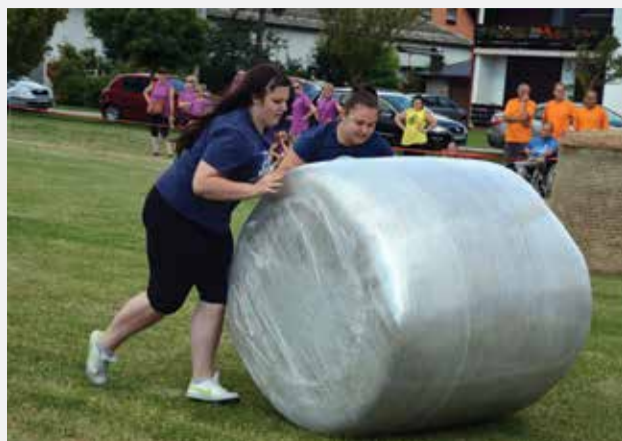
Utrka s balama

I ove godine dana 4. i 5. srpnja 2014. održane su tradicionalne četvrte po redu Seoske igre „Dobrava 2014“. Organizator ovih igara ponovno je bio Nogometni klub „Dubravčan“ Donja Dubrava. Održavanje igara financijski je potpomogla Općina Donja Dubrava.