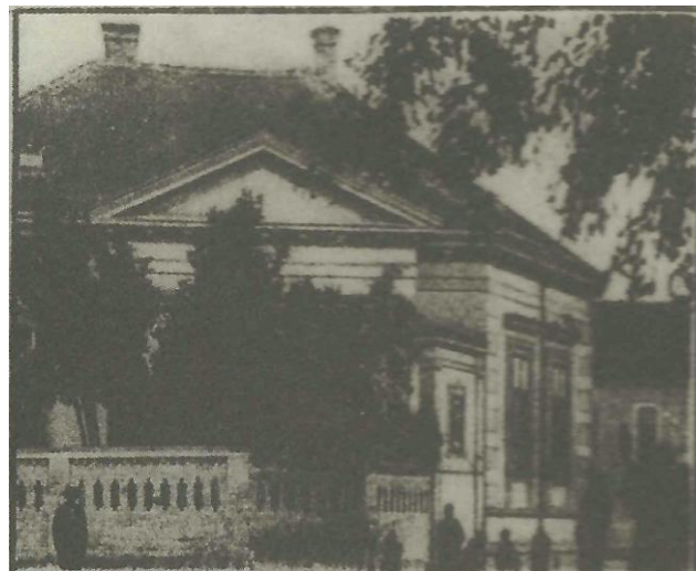
Kuća "Zalan" - fotografije sa starih razglednica

Građevina je uglovna visoka, podrumljena prizemnica historicističkih stilskih obilježja. Tlocrt je L – oblika, s vrlo kratkim bočnim krilom na istočnoj strani, dok je sjeverni kut građevine oblikovan tako da prati oblik ulice. Ulična pročelja su reprezentativno oblikovana i raščlanjena bogatim profilacijama u žbuci. Prozori su grupirani na način da odražavaju unutrašnji raspored prostorija. Svaki prozor je flankiran kaneliranim pilastrima sa kompozitnim kapitelima i nadvišen vijencem.