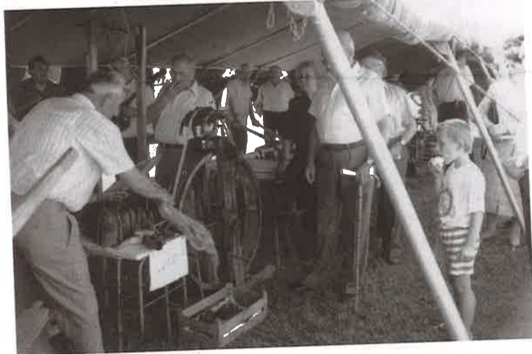
Izložba starih zanata

Slijedeći bogatu obrtničku i trgovačku tradiciju već duže vrijeme postoji ideja o obnavljanju sajmovi u D. Dubravi, odlučeno je da se ove godine održi sajam. Mnogo se raspravljalo o tome kakav sajam, je li klasični ili nešto suvremeniji.