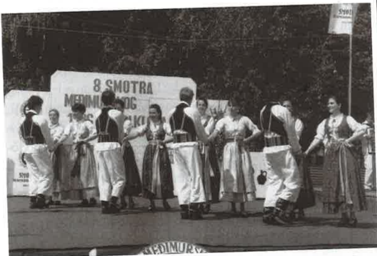
Brojnu publiku oduševio je nastup Kulturnog društva "Gradišće" iz Petrovog Sela u Mađarskoj koje je nastupilo kao gost Smotre

Organizacija Osme smotre pokazala je da je Donja Dubrava mjesto sposobno organizirati i najzahtjevnije manifestacije, o čemu svjedoče usmeni i pismeni izrazi zahvalnosti za toplu dobrodošlicu i odličnu organizaciju svih sudionika i gostiju Smotre. Napominjemo da su čestitke upućene svima onima koji su se na bilo koji način uključili u organizaciju te na taj način pomogli našem mjestu da gosti, odlazeći svojim kućama, ponesu najljepše dojmove o mjestu domaćinu.