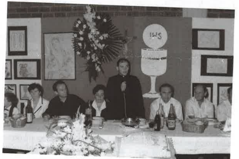
Oko stola na zajedničkom ručku s oko četrsto uzvanika

Naša Župa ima duhovnih zvanja. Od sada živih svećenika su ovi: vlč. Blaž Horvat