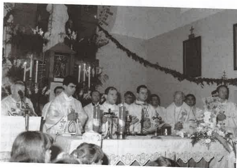
Oko oltara Gospodnjeg u našoj crkvi

Radost koju smo doživjeli ovih dana mora biti naš poticaj za daljnji bolji i kršćanskiji život. Kao župnik moram vas ponovno pozvati da se nedjeljom i blagdanima moramo više vidati, biti više zajedno oko stola Gospodnjeg. Moramo čuti što je volja Božja i kako ostvarivati svoj život da budemo jednog dana svi zajedno, gdje nam je Sin Božji Isus Krist pripremio kod svog i našeg Oca!