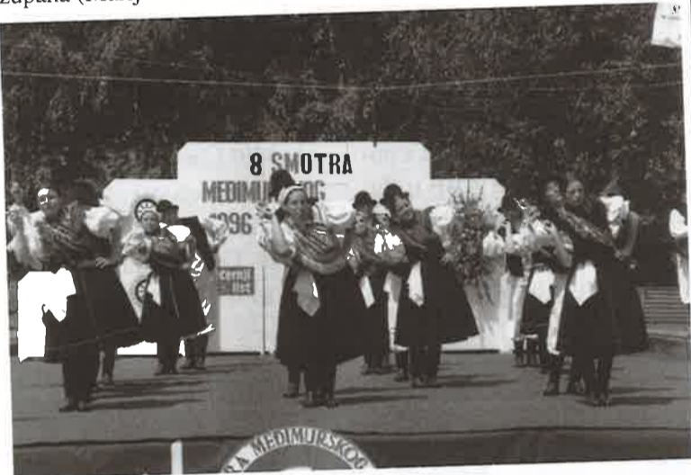
Nastup Ogranka seljačke sloge Donje Dubrave na Osmoj smotri međimurskog folklor

Imajući u vidu značenje i vrijednost ovakve manifestacije, domaćini su Smotri osigurali pokroviteljstvo Županije međimurske, župana (Marijana Ramušćaka) i Večernjeg lista.