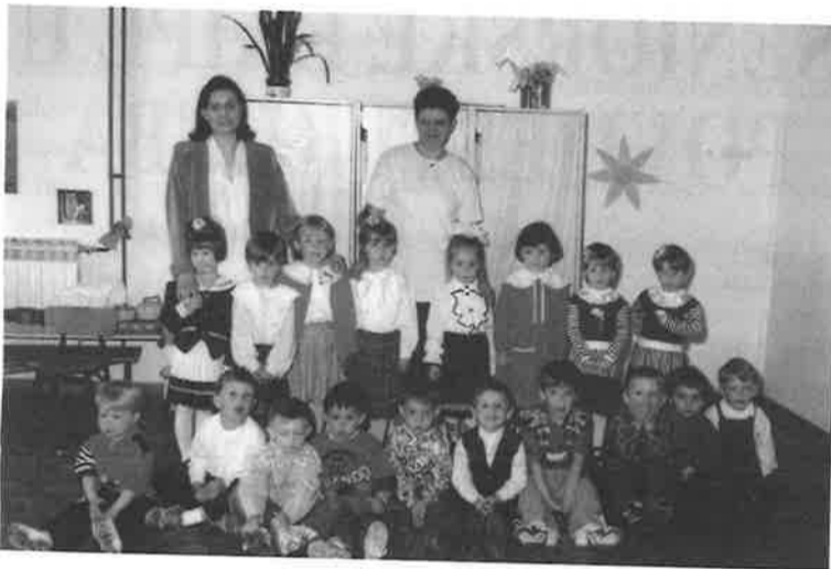
Mlađa grupa dječjeg vrtića

Ovom se prigodom zahvaljujemo svim roditeljima djece mlađe, srednje i starije skupine, koji su na bilo koji način pomogli uspješnoj realizaciji odgojno-obrazovnog rada u našoj ustanovi.