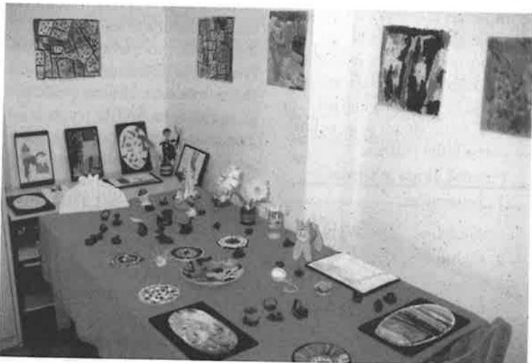
Radovi dječjeg vrtića