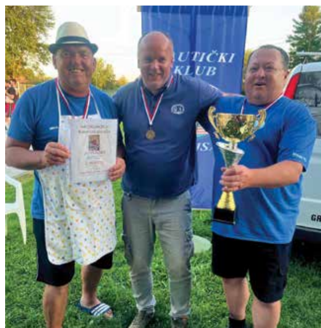
2. mjesto - Dobrovski kotlić