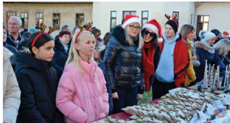
Izrada i pakiranje sapuna

U sklopu projekta već je prošle školske godine uređen kamenjar ispred škole s ljekovitim biljem koje će u budućnosti poslužiti kao baza za proizvode učeničke zadruge. Iako se krenulo u jednom novom smjeru u radu učeničke zadruge, ne zaboravljamo ni komušinu po kojoj je naša učenička zadruga poznata pa će se čuvati i dalje tradicija pletenja uporabnih proizvoda od komušine i biti jedna dobra poveznica planiranih