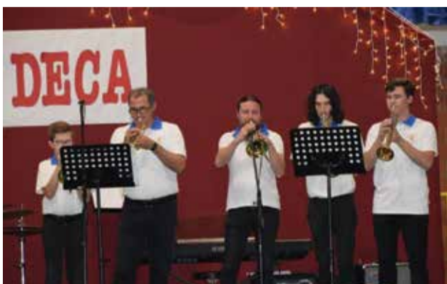
Memorijal - Deca, moja deca

Po završetku zajedničkog sviranja, orkestri su se vratili u Osnovnu školu Donja Dubrava na početak službenog dijela smotre u školsku sportsku dvoranu. Na smotri je sudjelovalo 10 orkestara, a gosti su bili i Big band iz Čakovca. Nakon službenog dijela smotre, održan je domjenak u prostorijama Nogometnog kluba „Dubravčan“.