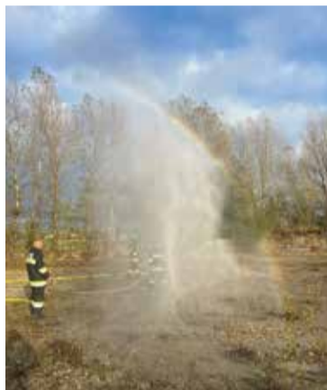
Mlaznica koja stvara vodeni zid