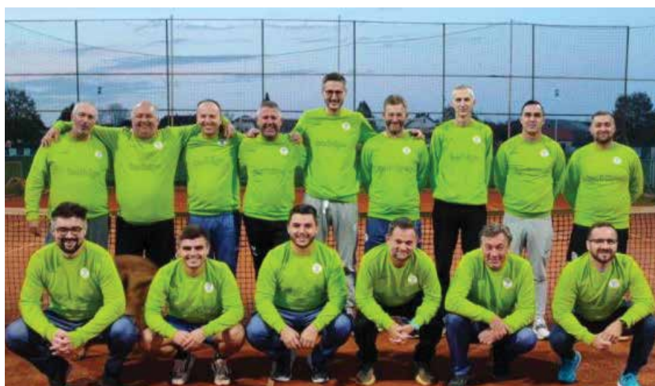
Ekipa TK Dubravčan