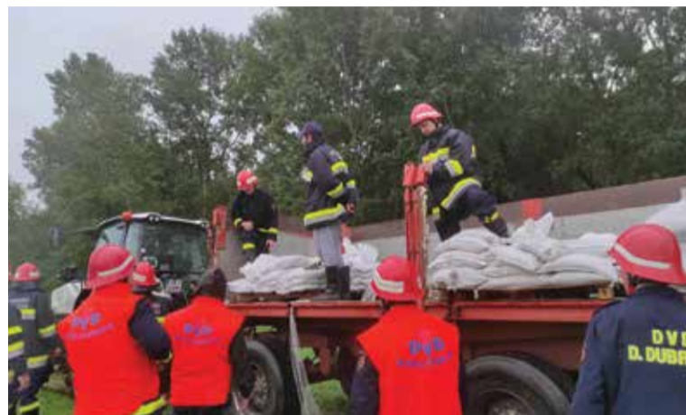
Traktori su prestali dovoziti vreće s pijeskom