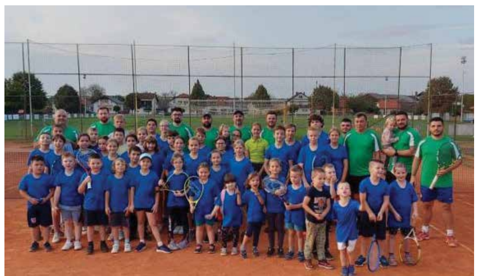
Mladi dobavski sportaši