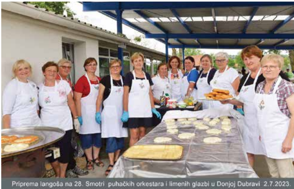
Príprema langoša na 28. Smotri puhačkih orkestara i limenih glazbi u Donjoj Dubravi 2.7.2023.

Bliži nam se kraju i ova kalendarska godina u kojoj smo uspješno realizirale planirane aktivnosti.