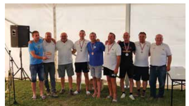
3. mjesto Fljojsari