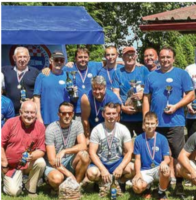
Fljojsari na Lovu na labuđe pero

S ponosom možemo reći da se već tradicionalno sudjelovalo na manifestaciji Nautičkog kluba „Labud“-„Lov