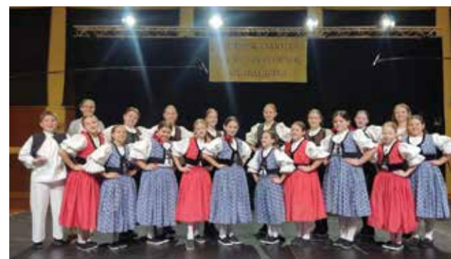
Na Županijskoj smotri u Maloj Subotici