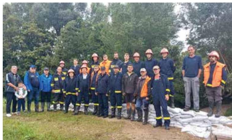
Zadovoljni „branitelji“ nakon uspješne obrane od poplave

stavka u našim intervencijama, moramo shvatiti koliko je važno održavati dimnjake ispravno. Ne prođe sezona loženja, a da po nekoliko puta ne bude poziva za njihovim gašenjem. Srećom, do sada smo takve situacije manje-više uspješno rješavali, ali upozoravamo mještane da su požari dimnjaka jako opasni ukoliko dođe do puknuća dimnjaka. U tom slučaju vatra se širi na krovne, a to je najmanje što biste željeli. Stoga vas upozoravamo da dimnjake redovito pregledavate, čistite i održavate ispravno da biste spriječili ono najgore. U intervencije moramo ubrojiti i obranu od izlivanja rijeke Mure što smo 6. kolovoza spriječili gradnjom „zečjih“ nasipa. Intervencija je trajala cijeli dan, a bilo je uključeno dvadesetak naših članova i nekoliko traktora koji su