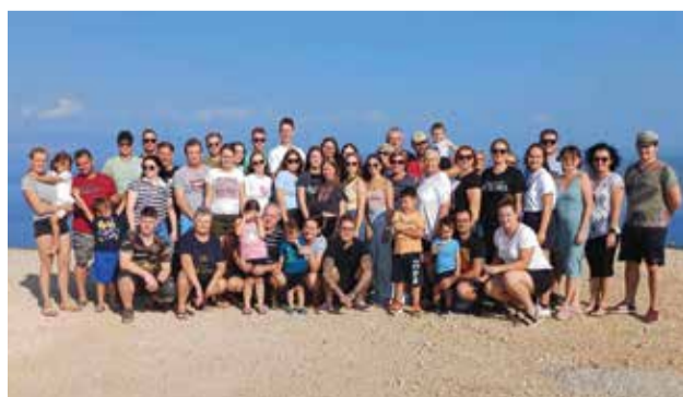
Izlet na Cres

Svako naše putovanje prati i nošnja, tamburice te nekoliko sati spremanja za nastup. No, na ovaj smo poseban izlet ponijeli samo međimursku pjesmu te smo 30. rujna otputovali do Cresa i Lošinja kako bismo napunili baterije za još nekoliko projekata i nastupa koji su nas čekali u nadolazećem razdoblju. Bilo nam je jako lijepo, plažom i hotelom se orila međimurska pjesma i riječ, a mali, veliki, mladi i stariji slogaši su iskovali i nove planove i projekte.