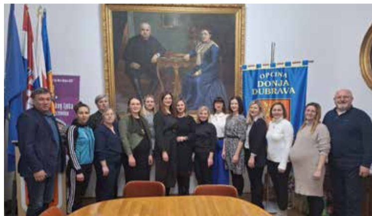
S Osnivačke skupštine DND Donja Dubrava