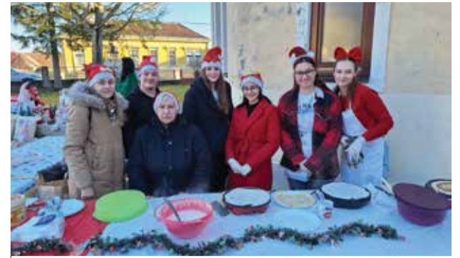
Na ovogodišnjim Adventskim radostima v Dobravi

U subotu, 4. studenog 2023. godine, održano je se popularno predavanje "Žena, majka, vještica. Progoni vještica u Europi i Hrvatskoj". Prisutni su saznali što je potaknulo progone, tko su bile žene optuživane da su vještice te je li bilo vještica u Donjoj Dubravi. Predavanje je održao dr. sc. Anđelko Vlašić, docent na Filozofskom fakultetu Sveučilišta Josipa Jurja Strossmayera u Osijeku na kojem predaje kolegij "Progoni vještica".