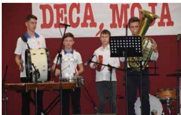
Memorijal - Deca, moja deca