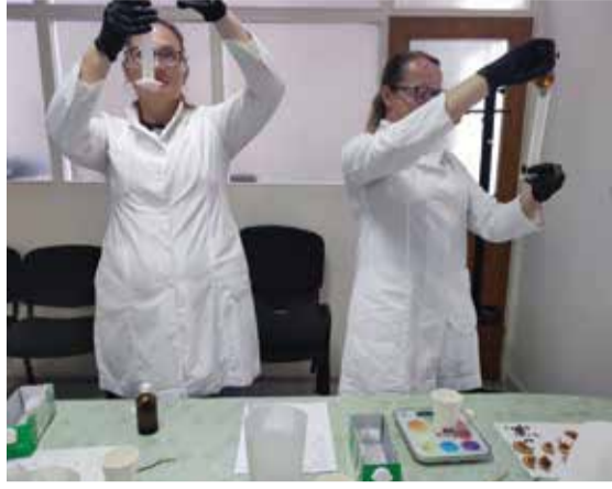
Edukacija voditeljica projekta