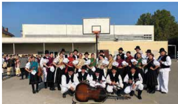
Seljačka sloga Donja Dubrava na Vinkovačkim jesenima

Prva postava KUD-a Seljačka sloga Donja Dubrava na Županijskoj smotri izvornog folkloru odabrana je kao predstavnik Međimurske županije na ovogodišnjim 58. Vinkovačkim jesenima. Slogaši su svoj put na Jeseni započeli 17. rujna 2023. ranojutarnjim polaskom kako bi na vrijeme bili spremni za najsvečaniji dio Vinkovačkih jeseni, mimohod svih kulturno umjetničkih društava. Nakon mimohoda, ugostili su ih folkloristi iz Privlake, a nakon ručka i kratkog odmora, uputili su se ponovo u Vinkove na samu završnicu manifestacije, Državnu smotru izvornog folkloru gdje su pokazali svu raskoš međimurske pjesme, plesa i sviranja.