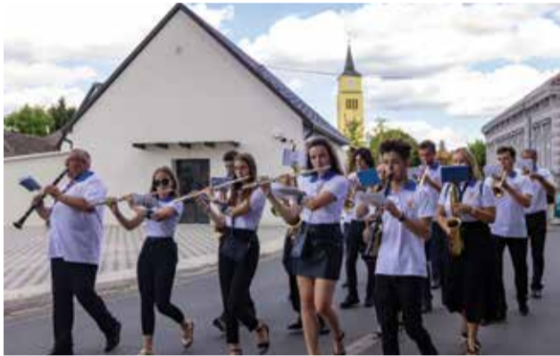
28. Županijska smotra puhačkih orkesatara i limenih glazbi