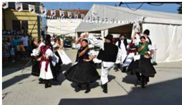
Na Danima ljuka i ekološke proizvodnje

Općina Donja Dubrava i Duga, društvo za biološko-dinamičko gospodarstvo Čakovec, bili su 27. kolovoza 2023. po 16. put organizatori i domaćini manifestacije Dana dobavskog ljuka i ekološke proizvodnje. Manifestaciju, koja u svojoj biti čuva našu tradiciju u proizvodnji domaćih poljoprivrednih i ostalih proizvoda, uveličali su i članovi KUD-a. Nastupali su članovi prve postave slogaša te dječji folklor.