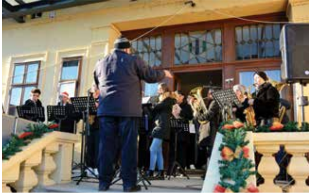
2. Adventske radosti v Dobravi