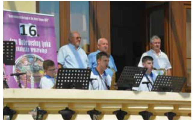
16. Dani ljuka i ekološke proizvodnje