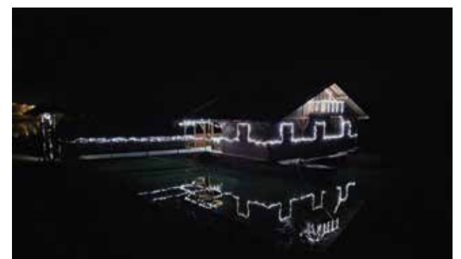
Vodena čarolija - dom Nautičkog kluba