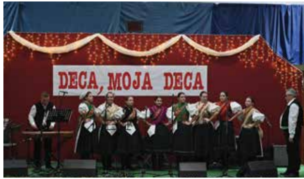
Ženska vokalna skupina KUD-a Seljačka sloga D.Dubrava