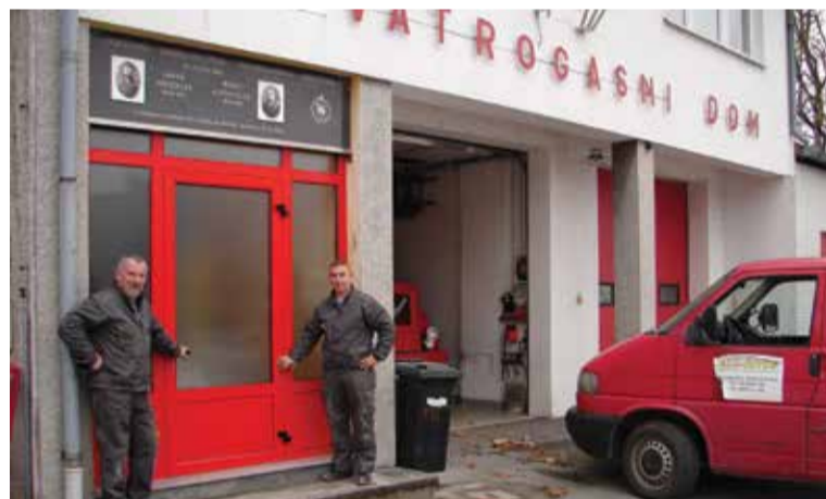
Nova vrata na ulazu u Vatrogasni dom

I za kraj spomenimo još samo tri „nevatrogasne“ aktivnosti. Kao i dosada, uvijek pomažemo dubravskom udrugama. Tako smo u kolovozu bili pratnja županijske smotre puhačkih orkestara koja se ove godine održavala u Donjoj Dubravi. Drugo čime se možemo pohvaliti je rad na uređenju našeg vatrogasnog doma. Nakon garažnih vrata, na red su došla i ulazna vrata vatrogasnog doma čime je obnova vanjskog izgleda našeg doma završena. I kao posljednje spomenimo proslavu 135. godišnjice osnutka našeg društva. Godišnjicu smo obilježili skromnom proslavom uz dan našeg zaštitnika sv. Florijana, a ovih dana, uoči Božića, za naše smo mještane pripremili