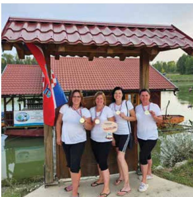
1. mjesto Fljojsarice