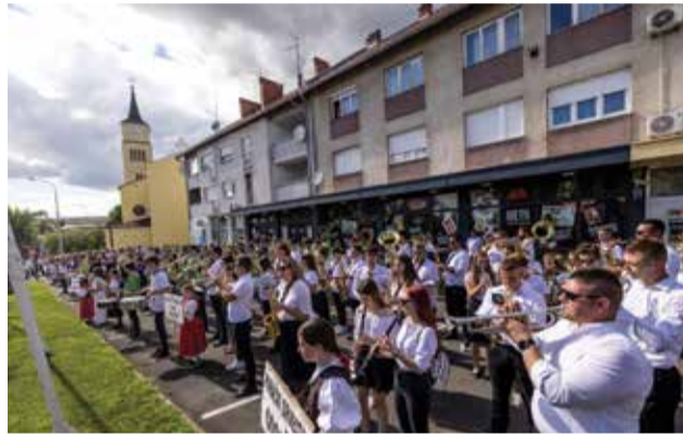
300 svirača u centru Donje Dubrave